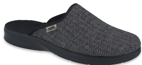
080 548M024 39-47 czarny, czarny, black