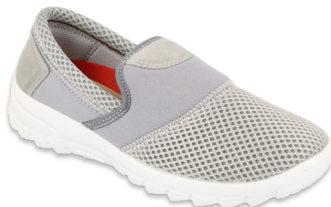
114 517D009 39-41 popiel, šedý, ashen