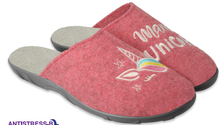
ANTISTRESS-B SYSTEM 014 235D186 róż, różowy, pink