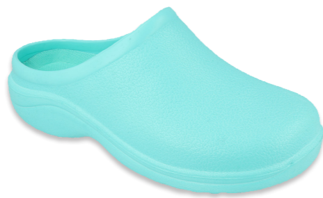
134 154D005 36-41 turkus, tyrkysový, turquoise