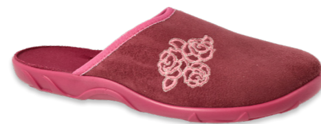
ANTISTRESS-B SYSTEM 026 235D158 36-41 bordo, bordó, burgundy