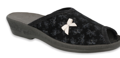
054 581D198 36-41 czarny, černý, black