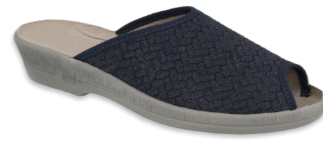
055 581D199 36-41 czarny, černý, black