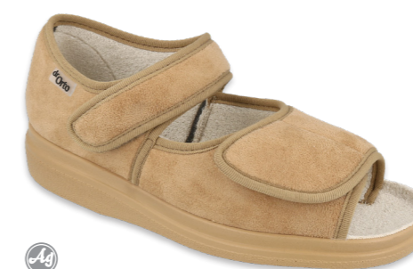
156 989D003 36-41 beż, bėżový, beige