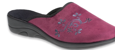
033 552D004 36-41 bordo, bordó, burgundy