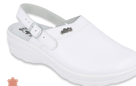
139 157D001 35-41 biały, bílý, white