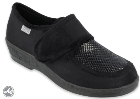
179 984D012 35-37 czarny, černý, black