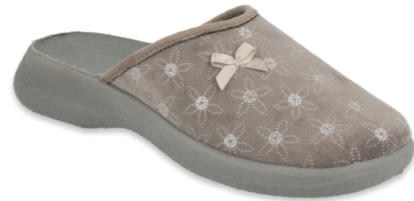
040 019D127 36-41 szary, šedý, gray