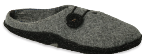
105 155D128 37-40 szary, šedý, gray