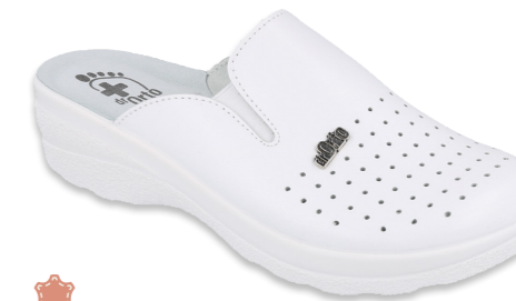
148 157D006 35-41 biały, bílý, white