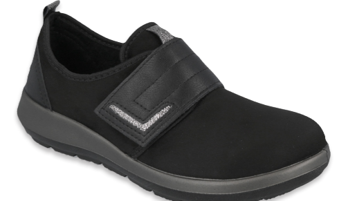
127 156D002 36-41 czarny, černý, black