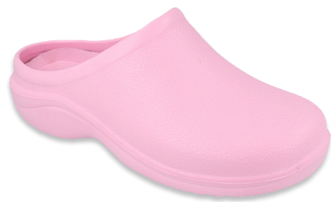
133 154D006 36-41 róż, růžový, pink