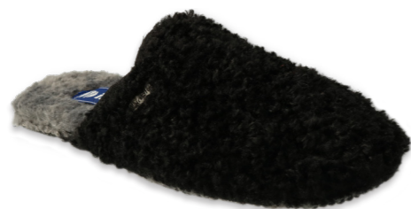
103 155D127 36-41 czarny, černý, black