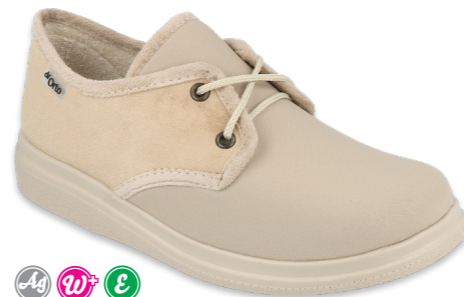
190 990M002 42-48 bež, béžový, beige