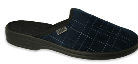
092 089M409 40-47 czarny, czerný, black