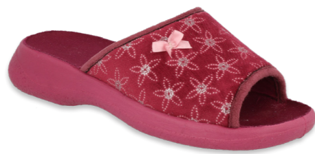
043 442D194 36-41 bordo, bordó, burgundy