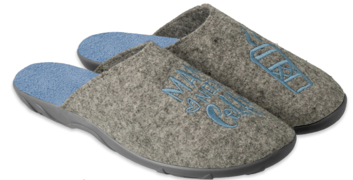
ANTISTRESS-B SYSTEM 016 235D188 szary, szedý, gray