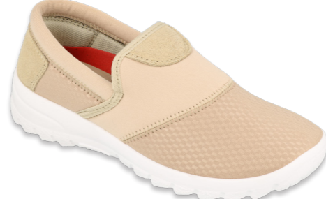
112 517D008 37-42 bež, béžový, beige