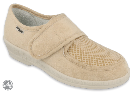
180 984D011 36-37 bež, béžový, beige