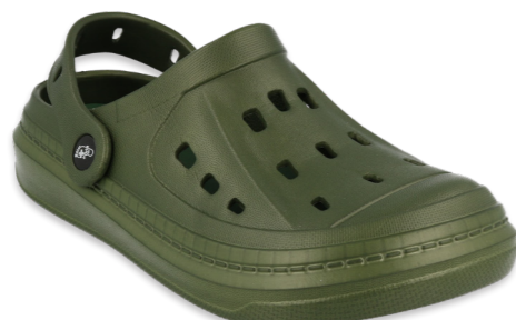
138 154M004 40-45* zielony, zelený, green

* zniženo o dva rozmiary / sníženo o dva čísla / two sizes smaller