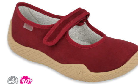
173 197D003 36-41 bordo, bordó, burgundy