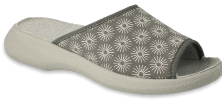
045 442D197 36-41 szary, šedý, gray