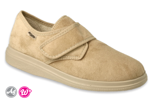
196 036D032 36-41 bež, béžový, beige