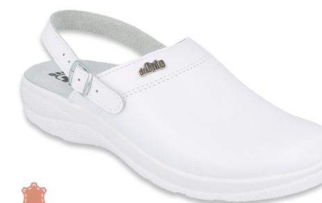
140 157M101 41-47 biały, bílý, white