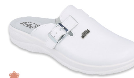
144 157M103 41-47 biały, bílý, white