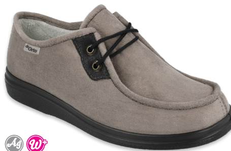
185 871M006 42-48 szary, šedý, gray