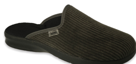
088 548M028 39-47 khaki