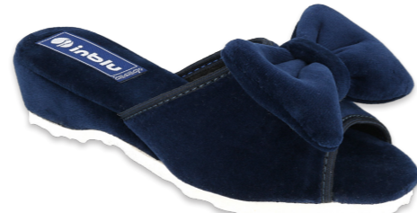
100 155D118 38-41 granat, granátový, navy