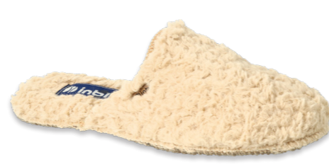
104 155D126 36-41 bež, béžový, beige