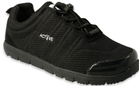
108 517D002 38-41 czarny, černý, black