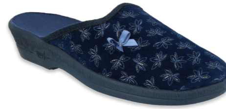
049 219D477 36-41 granat, granátový, navy