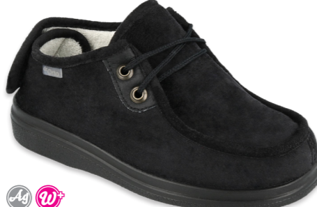
189 387D005 36-41 czarny, černý, black