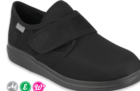
198 036D006 36-41 036M006 42-48 czarny, černý, black