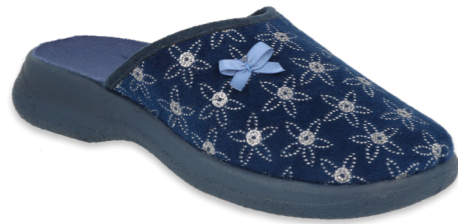
039 019D126 36-41 granat, granátový, navy