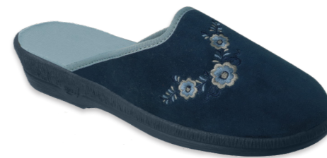
048 219D481 35-42 granat, granátový, navy