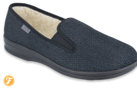
209 013M319 39-46 grafitowy, grafit, graphite