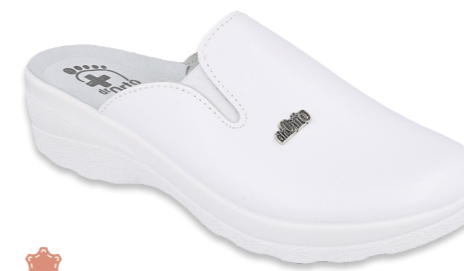
147 157D005 35-41 biały, bílý, white