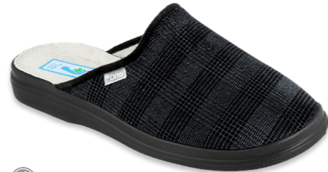
163 132M016 42-48 czarny, černý, black