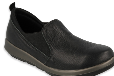
128 156D102 36-40 czarny, černý, black