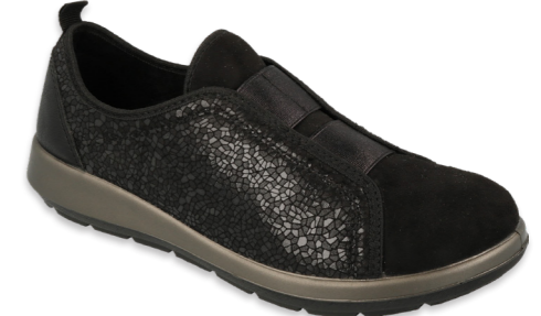
121 156D104 36-40 czarny, černý, black