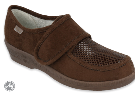
181 984D010 36-38 brąz, hnědý, brown