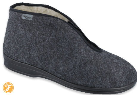
207 100M047 39-46 szary, šedý, gray