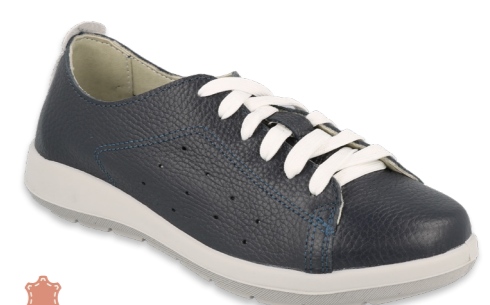
130 156D011 36-41 granat, granátový, navy