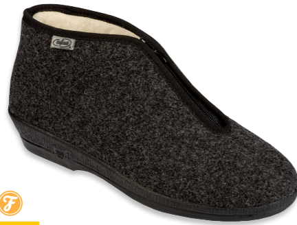
205 041D052 35-44 szary, šedý, gray