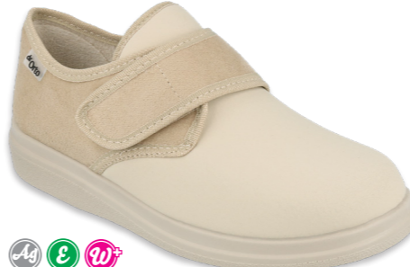
197 036D005 36-41 036M005 42-48 bež, béžový, beige