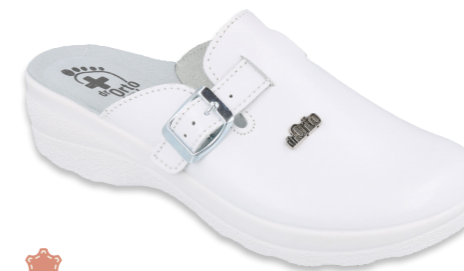
143 157D003 35-41 biały, bílý, white