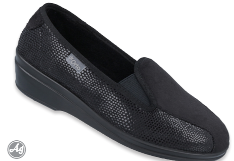
184 034D002 35-41 czarny, černý, black