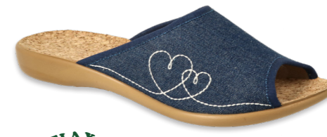
070 254D144 36-41 biały, biały, white