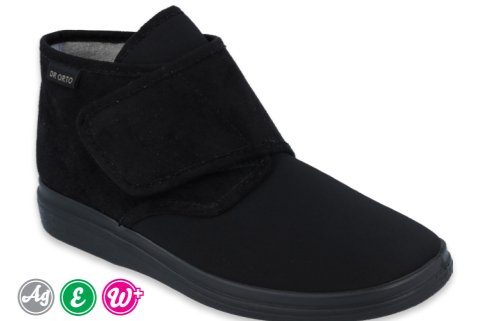
193 522D002 36-41 522M002 42 czarny, černý, black