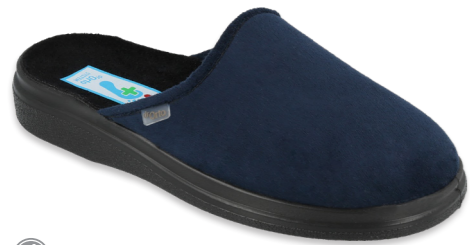
161 132D006 36-41 132M006 42-48 granat, granátový, navy