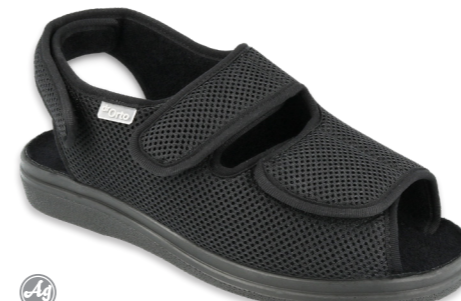
152 676M007 42-48 czarny, černý, black