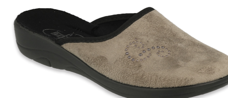
036 552D014 36-41 szary, šedý, gray