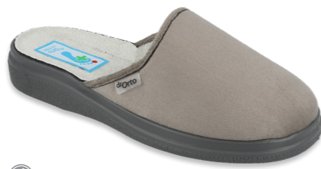
162 132D010 36-41 132M010 42-48 popiel, šedý, ashen