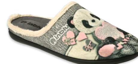
003 155D209 35-41 MUMMY & ME