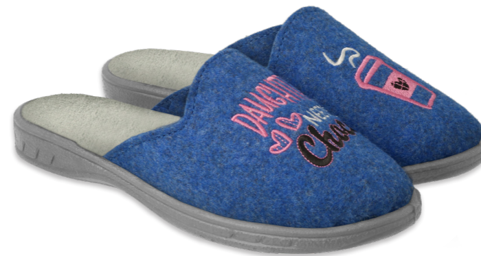
015 707Y429 niebieski, modry, blue