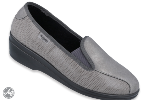
183 034D003 35-41 szary, šedý, gray