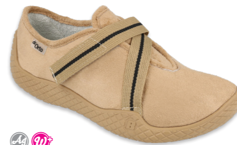
177 434D017 36-41 bež, béžový, beige