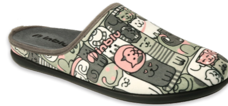
001 155D208 35-41 MUMMY & ME