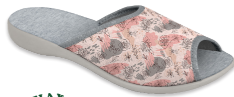
059 254D149 36-41 wielobarwny, więcejbarwny, multicolor