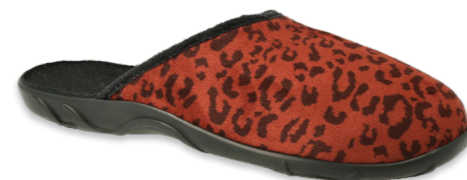
ANTISTRESS-B SYSTEM 025 235D182 36-41 bordo, bordó, burgundy