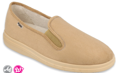
164 991M001 42-48 bež, béžový, beige