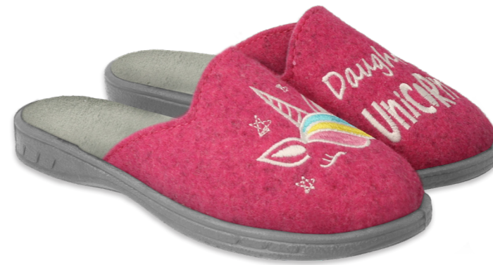
013 707X427 róż, różowy, pink