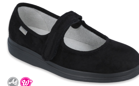
170 462D002 36-41 czarny, černý, black