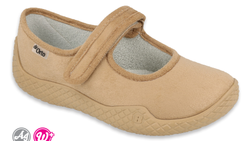
174 197D004 36-41 bež, béžový, beige