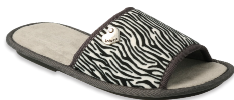
101 155D120 36-41 wielobarwny, vícebarevný, multicolor