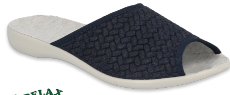
065 300D046 36-41 czarny, černý, black