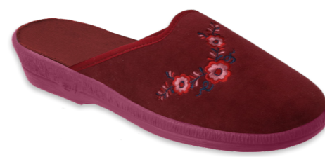
047 219D480 35-42 bordo, bordó, burgundy