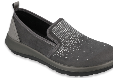
123 156D005 36-40 szary, šedý, gray