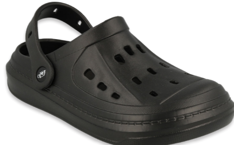
136 154M002 40-45* czarny, černý, black