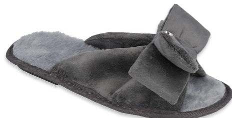
099 155D111 36-41 szary, šedý, gray