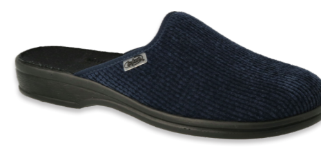
096 089M421 40-47 granat, granátový, navy