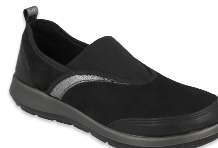
129 156D006 36-39 czarny, černý, black