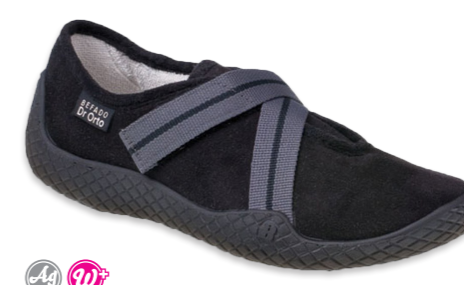
178 434D014 36-41 czarny, černý, black