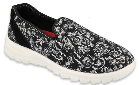
118 517D019 38-41 czarny, černý, black