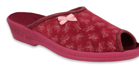
053 581D197 36-41 bordo, bordó, burgundy