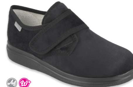
200 036D007 36-41 036M007 42-48 czarny, černý, black