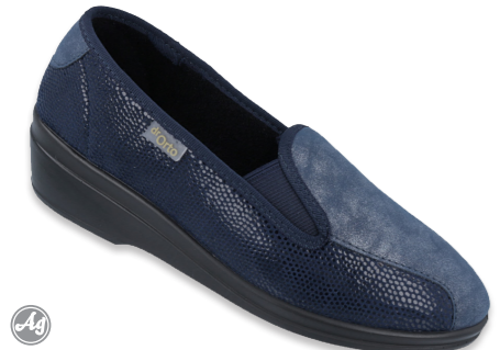
182 034D001 35-41 granat, granátový, navy