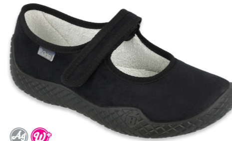
172 197D002 36-41 czarny, černý, black