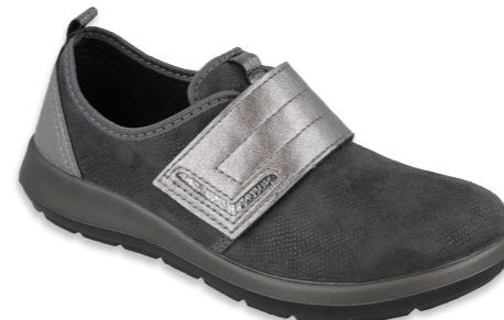
125 156D003 36-40 szary, šedý, gray