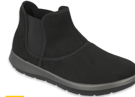
120 156D007 36-41 czarny, černý, black