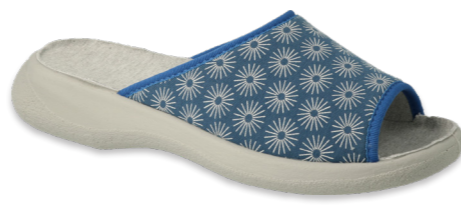
046 442D198 36-41 niebieski, modrý, blue