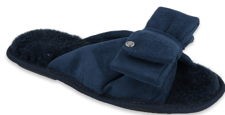
098 155D109 36-41 granat, granátový, navy