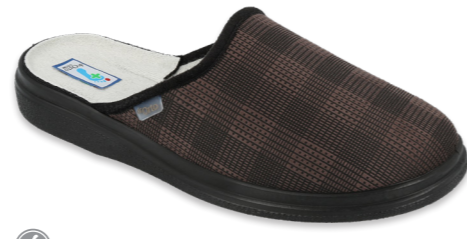
160 132M017 42-48 brąz, hnědý, brown