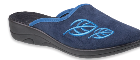
034 552D002 36-41 granat, granátový, navy