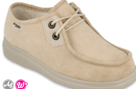
186 871D007 36-41 bež, béžový, beige