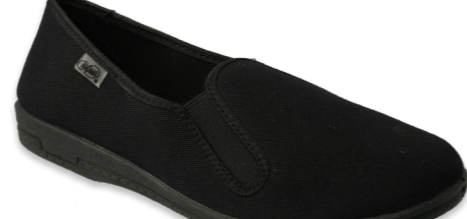
091 001M060 39-47 czarny, czerný, black