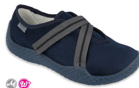
175 434D015 36-41 granat, granátový, navy