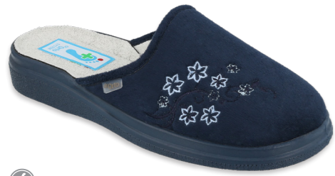
158 132D012 36-41 granat, granátový, navy