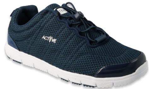
110 517D004 38-41 granat, granátový, navy