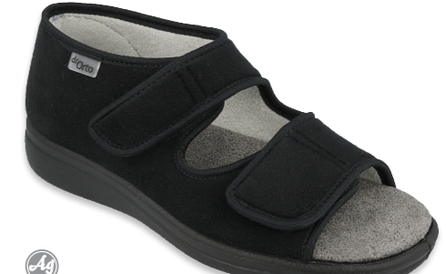
154 070D001 36-41 070M001 42-46 czarny, černý, black