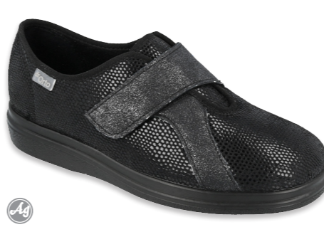
194 039D002 36-41 czarny, černý, black