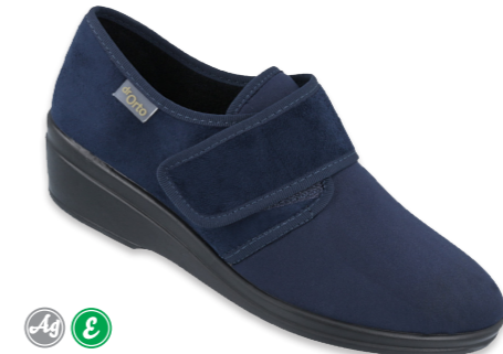
192 033D001 35-38 granat, granátový, navy