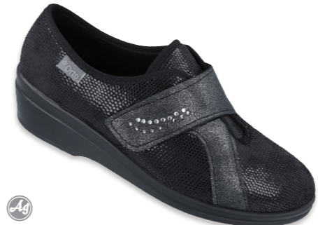
191 032D002 36-41 czarny, černý, black