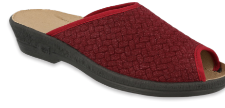
056 581D201 36-41 bordo, bordó, burgundy