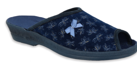
052 581D196 36-41 granat, granátový, navy