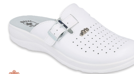
146 157M104 43-47 biały, bílý, white