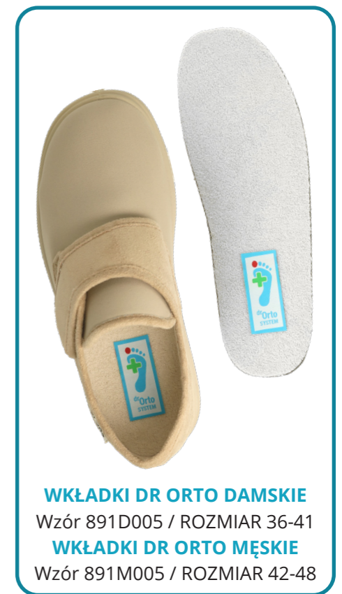
WKŁADKI DR ORTO DAMSKIE Wzór 891D005 / ROZMIAR 36-41 WKŁADKI DR ORTO MĘSKIE Wzór 891M005 / ROZMIAR 42-48