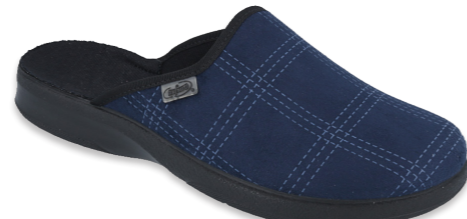
085 548M006 39-47 granat, granátový, navy