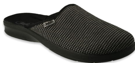
081 548M025 39-47 szary, szedý, gray