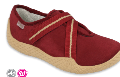
176 434D016 36-41 bordo, bordó, burgundy