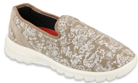
116 517D020 37-41 bež, béžový, beige