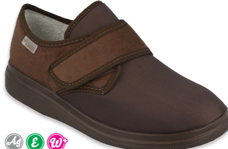
199 036D008 36-41 036M008 42-48 brąz, hnědý, brown