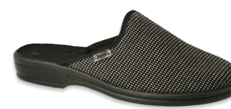
097 089M422 39-47 czarny, czerný, black