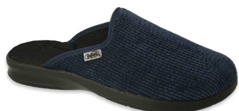
089 548M029 39-47 granat, granátový, navy