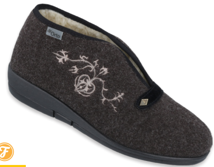
201 031D027 36-41 brąz, hnědý, brown