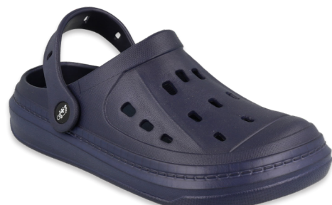
137 154M003 40-45* granat, granátový, navy