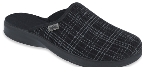
084 548M003 39-47 czarny, czerný, black