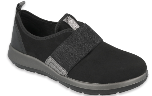
124 156D001 36-40 czarny, černý, black