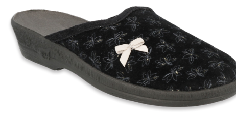
051 219D479 36-41 czarny, černý, black