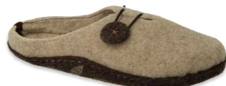
106 155D129 36-40 bež, béžový, beige