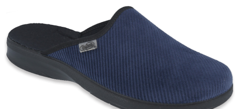
086 548M019 39-47 granat, granátový, navy