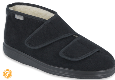
208 986D011 36-41 986M011 42-48 czarny, černý, black