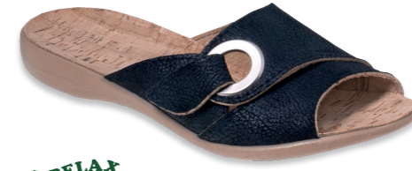
076 265D007 36-41 niebieski, modrý, blue