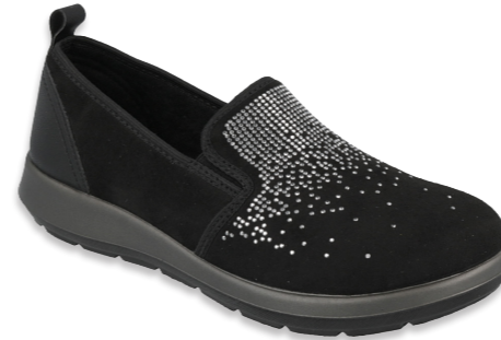
122 156D004 36-41 czarny, černý, black