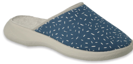
042 019D129 36-41 niebieski, modrý, blue