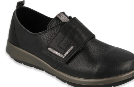
126 156D103 36-40 czarny, černý, black