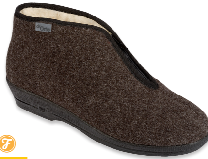
206 041D048 35-42 brąz, hnědý, brown