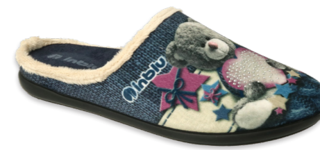
002 155D210 35-41 MUMMY & ME