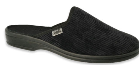
095 089M419 39-47 czarny, czerný, black