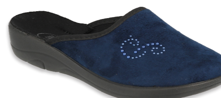
035 552D013 36-41 granat, granátový, navy