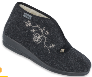
202 031D028 36-41 szary, šedý, gray