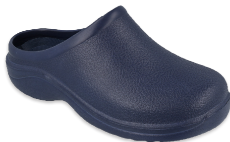
132 154D003 36-41 granat, granátový, navy