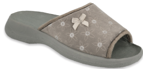
044 442D196 36-41 szary, šedý, gray