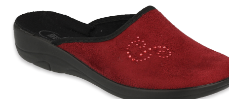
037 552D012 36-41 bordo, bordó, burgundy