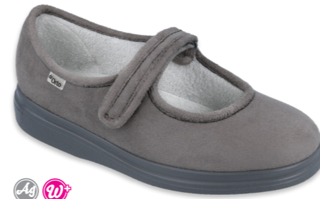
169 462D001 36-41 popiel, šedý, ashen