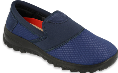
111 517D007 38-41 granat, granátový, navy