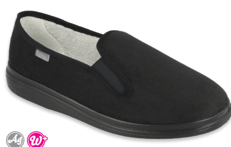
165 991M002 39-48 czarny, černý, black