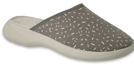
041 019D128 36-41 szary, šedý, gray