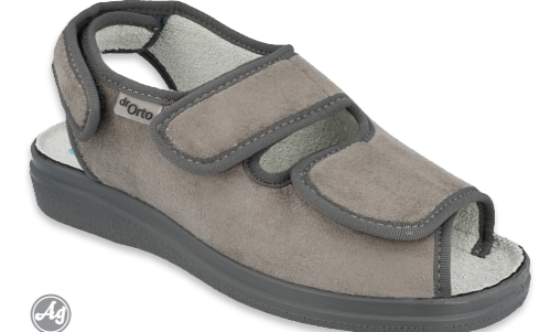
151 676D006 36-41 676M006 42-48 popiel, šedý, ashen