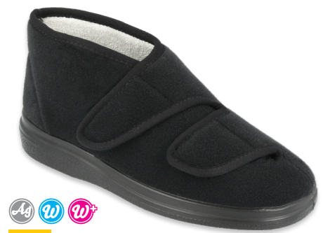
167 986D003 36-41 986M003 42-48 czarny, černý, black