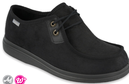
188 871D004 36-41 871M004 42-48 czarny, černý, black