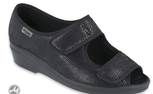
157 051D014 36-38 czarny, černý, black

Ag Tkanina SILBER z aktywnymi jonami srebra. Polecana szczególnie dla diabetyków i na stopę cukrzycową