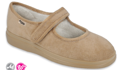
171 462D003 36-41 bež, béžový, beige