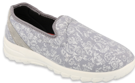
117 517D021 38-42 popiel, šedý, ashen