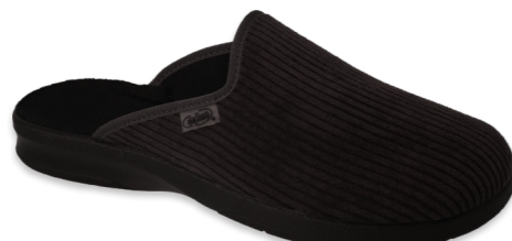
090 548M030 39-47 czarny, czerný, black