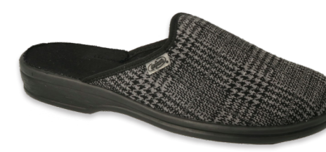
094 089M417 39-47 czarny, czerný, black