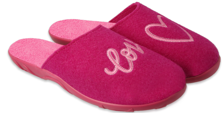
ANTISTRESS-B SYSTEM 018 235D187 róż, różowy, pink