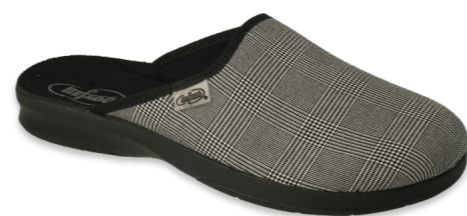
082 548M027 39-47 popiel, szedý, ashen