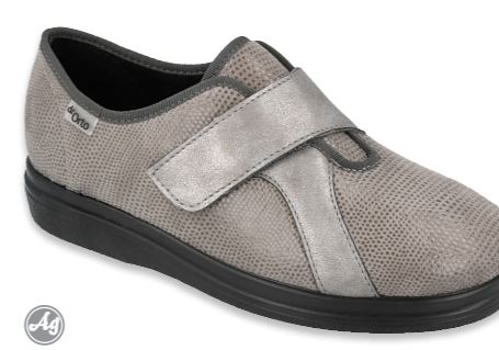
195 039D003 36-41 szary, šedý, gray