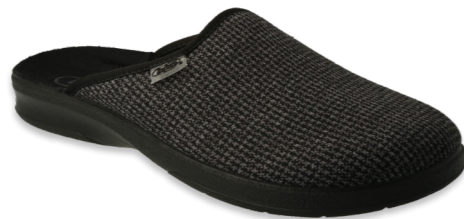
087 548M026 39-47 popiel, szedý, ashen