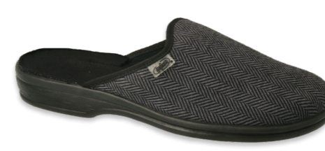
093 089M416 39-47 czarny, czerný, black