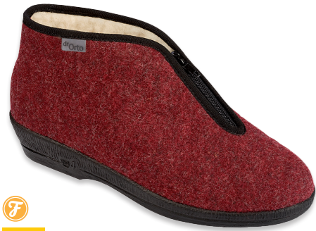
204 041D050 35-43 bordo, bordó, burgundy