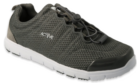
107 517D001 38-41 szary, šedý, gray