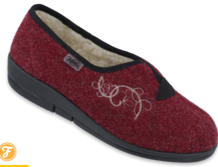
203 940D355 36-43 bordo, bordó, burgundy