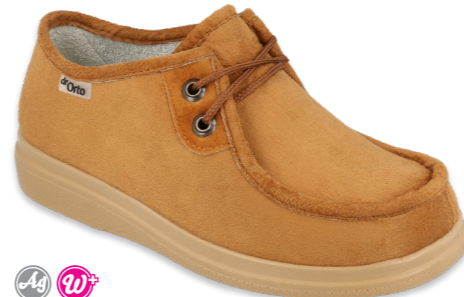
187 871D005 36-41 karmel, karamelový, caramel