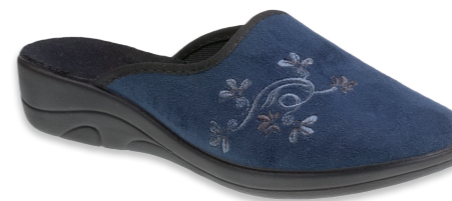
032 552D005 36-41 granat, granátový, navy