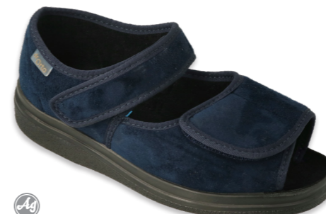
155 989D004 36-41 989M004 42-46 granat, granátový, navy