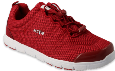
109 517D003 38-41 czerwony, červený, red