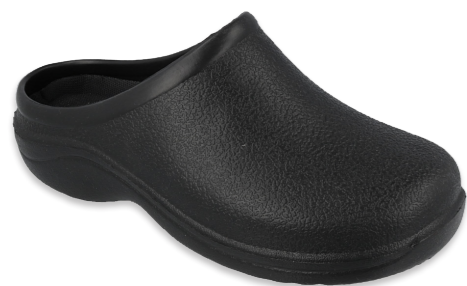
131 154D001 36-41 czarny, černý, black