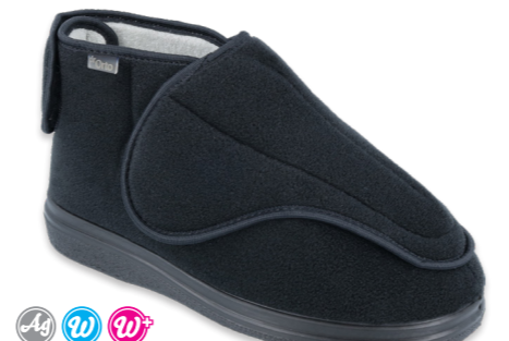
166 163D002 36-41 163M002 42-48 czarny, černý, black