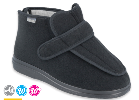
168 987D002 36-41 987M002 42-48 czarny, černý, black