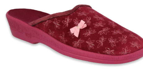
050 219D478 36-41 bordo, bordó, burgundy