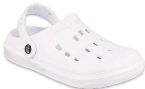
135 154M001 40-45* biały, bílý, white