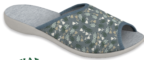
058 254D148 36-41 wielobarwny, więcejbarwny, multicolor