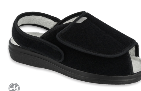
153 983D004 36-41 983M004 42-48 czarny, černý, black