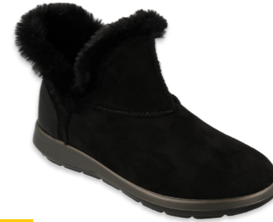
119 156D903 36-41 czarny, černý, black