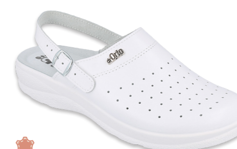
142 157M102 41-47 biały, bílý, white