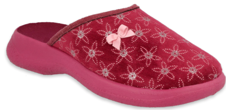
038 019D125 36-41 bordo, bordó, burgundy