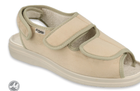
150 676D004 36-41 beż, bėżový, beige