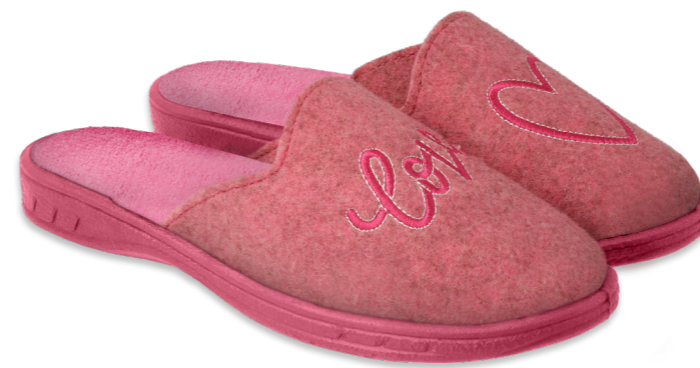
017 707Y428 róż, różowy, pink