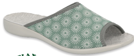
061 254D140 36-41 szary, szedý, gray