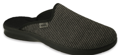
083 548M031 39-47 czarno/biały, czerný a bílý, black/white