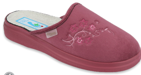
159 132D014 36-41 bordo, bordó, burgundy