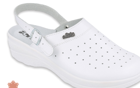
141 157D002 35-41 biały, bílý, white