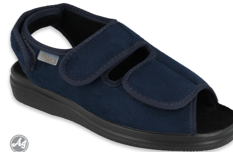
149 676D003 36-41 granat, granátový, navy