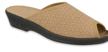
057 581D200 36-42 bež, béžový, beige