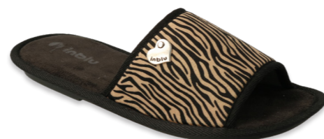
102 155D121 37-40 wielobarwny, vícebarevný, multicolor