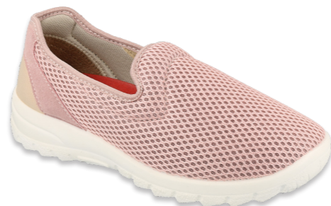
115 517D022 38-41 róż, růžový, pink