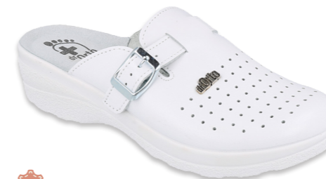
145 157D004 35-41 biały, bílý, white