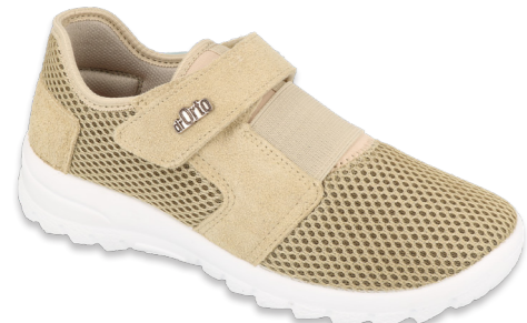
113 517D012 39-41 bež, béžový, beige