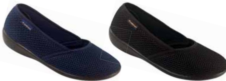
53 art. 23274 GR/CZ