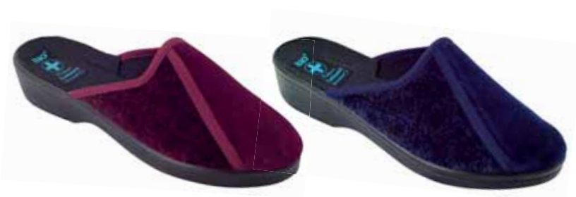
142 art. 197 BO/CZ