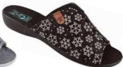
30 art. 24218 CZ/CZ