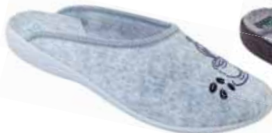
102 art. 23338 B1/SZJ