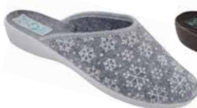
31 art. 24215 SZ/SZJ