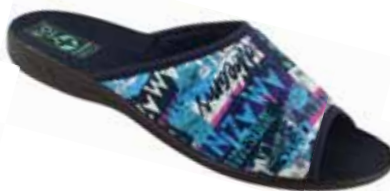
57 art. 24122 NI/CZ