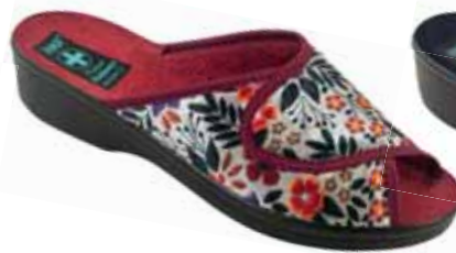
138 art. 24145 BZC/CZ