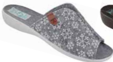
29 art. 24217 SZ/SZJ