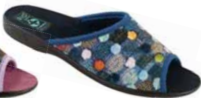
56 art. 24231 GR/CZ