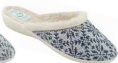
48 art. 24320 GR/BZ