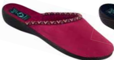
43 art. 20916 B0/CZ