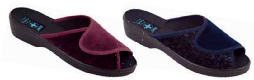
140 art. 8620 BO/CZ