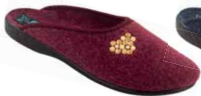
100 art. 24475 B0/CZ