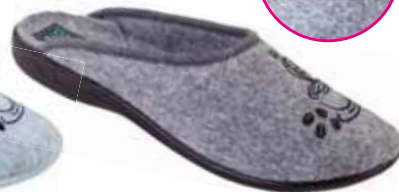
103 art. 23340 SZ/CZ