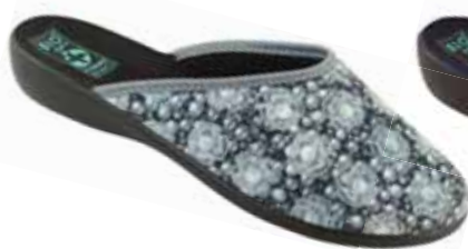
35 art. 24289 SZ/CZ