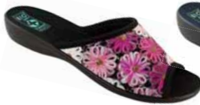
27 art. 24190 R0/CZ