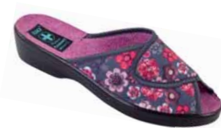
137 art. 23473 SZC/CZ