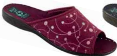
59 art. 24199 BU/CZ