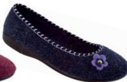
107 art. 16271 GR/CZ