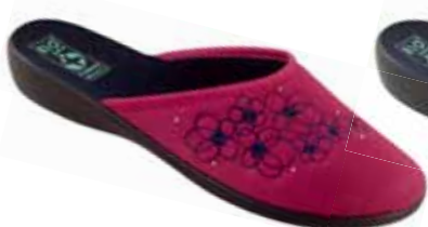
45 art. 24229 MA/CZ