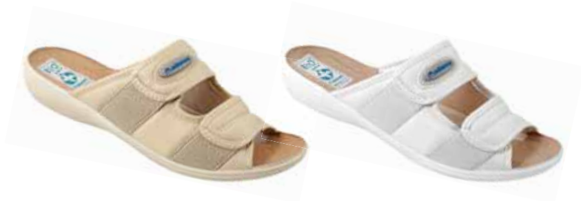
15 art. 17660 BZ/BZ