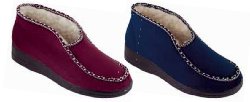
13 art. 17013 BO/CZ