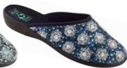
36 art. 24288 GR/CZ