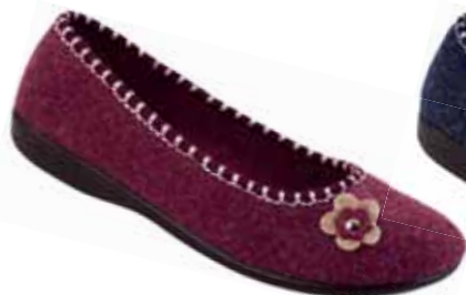
106 art. 16270 B0/CZ