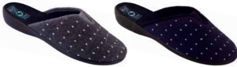
51 art. 22372 SZ/CZ