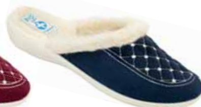
50 art. 19380 GR/BZ