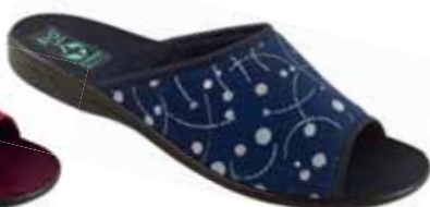
60 art. 24200 GR/CZ