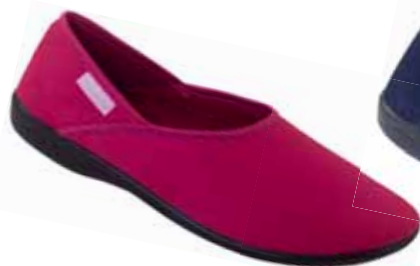
104 art. 23551 MA/CZ