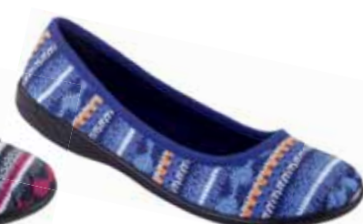
111 art. 23561 GR/CZ