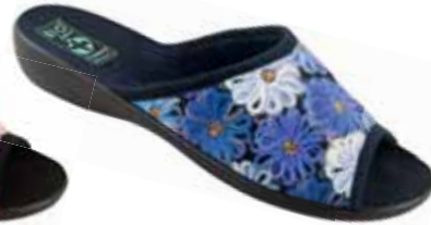
28 art. 24189 GR/CZ