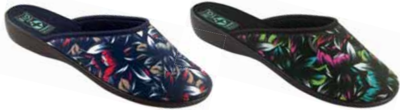
37 art. 24304 GR/CZ