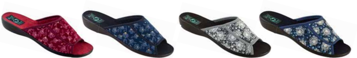
17 art. 24328 BZ/CZ