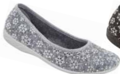
108 art. 24213 SZ/SZJ