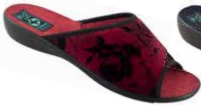
25 art. 24285 B0/CZ