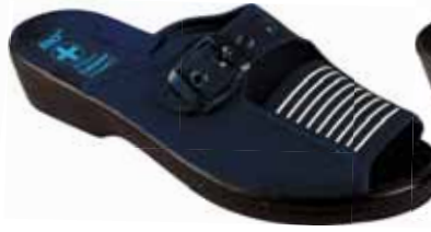
135 art. 34 GR/CZ