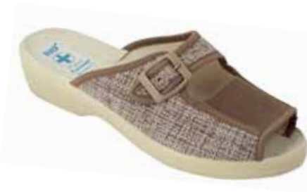
134 art. 12781 BZC/BZ