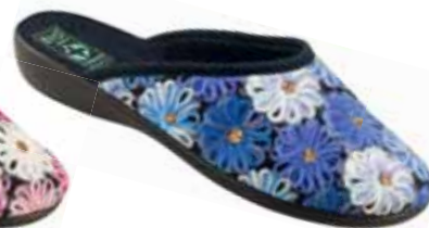
42 art. 24192 GR/CZ