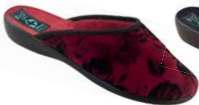
39 art. 24284 B0/CZ