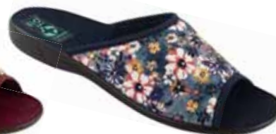
62 art. 24179 GR/CZ