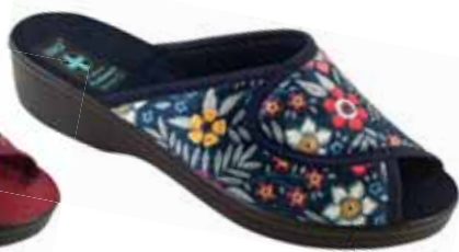
139 art. 24316 GR/CZ