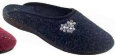
101 art. 24474 GR/CZ