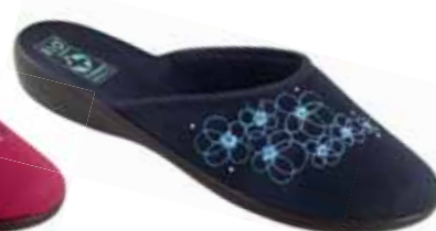
46 art. 24227 GR/CZ