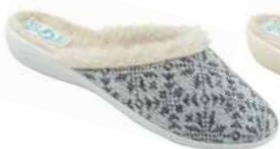
47 art. 24322 SZ/SZJ