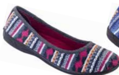
110 art. 23560 B0/CZ