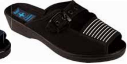
136 art. 33 CZ/CZ