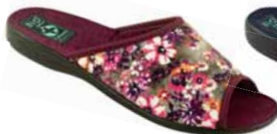
61 art. 24178 BU/CZ