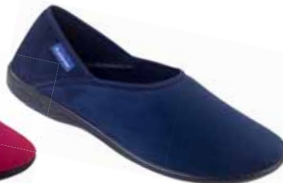
105 art. 23552 GR/CZ