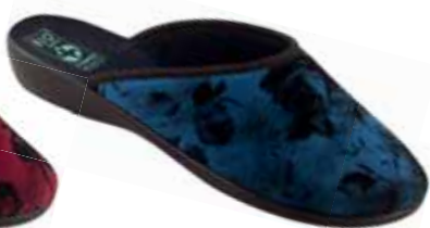
40 art. 24281 GR/CZ