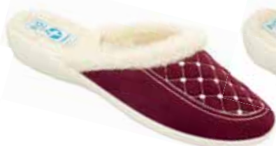
49 art. 19379 B0/BZ