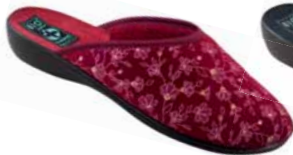
33 art. 24452 B0/CZ