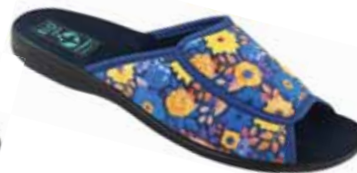
58 art. 24295 NI/CZ