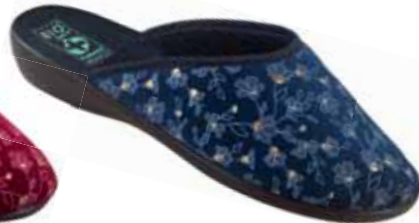
34 art. 24453 GR/CZ