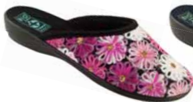
41 art. 24193 R0/CZ