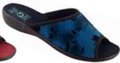
26 art. 24280 GR/CZ