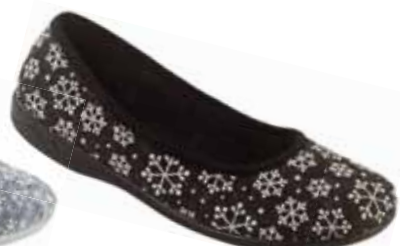
109 art. 24214 CZ/CZ