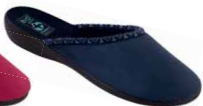
44 art. 20917 GR/CZ