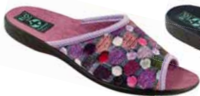
55 art. 24232 FC/CZ