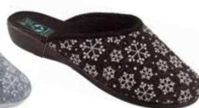
32 art. 24216 CZ/CZ