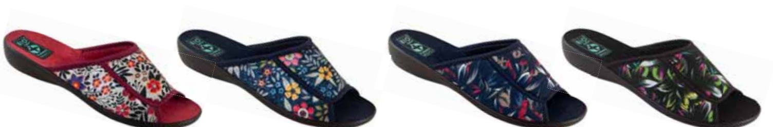
21 art. 24317 BZ/CZ