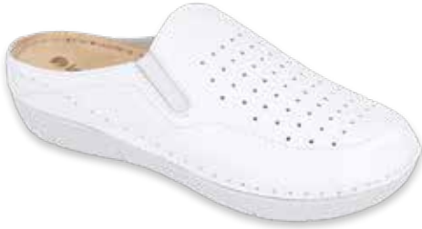
WZÓR ROZMIAR 158D136 36-41