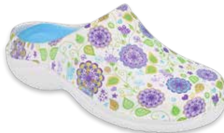
18 MODEL ROZMIAR 154D103 36-41