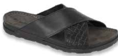
WZÓR ROZMIAR 158M002 40-46