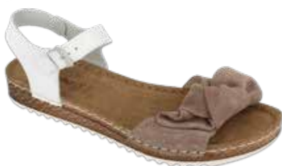
WZÓR ROZMIAR 158D152 36-41