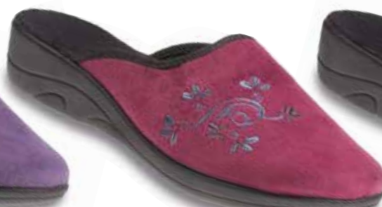
55 552D004 35-41 Jula