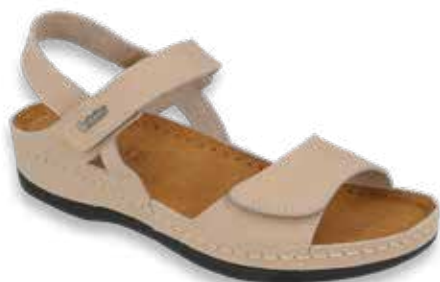
WZÓR ROZMIAR 158D102 36-41