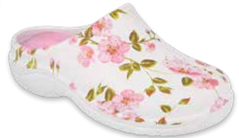
16 MODEL ROZMIAR 154D101 36-41