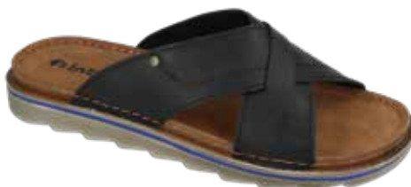
WZÓR ROZMIAR 158M006 40-46