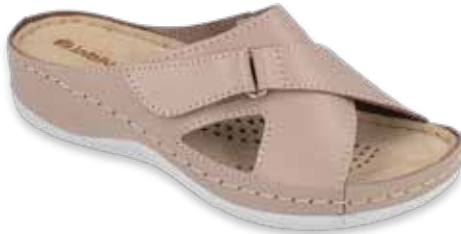
WZÓR ROZMIAR 158D140 36-41