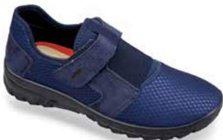
7 MODEL ROZMIAR 517D011 37-42