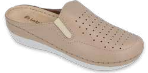
WZÓR ROZMIAR 158D144 36-41