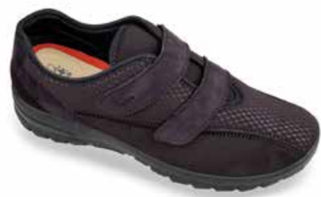
10 MODEL ROZMIAR 517D014 37-42