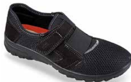
6 MODEL ROZMIAR 517D010 37-42