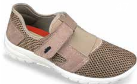
8 MODEL ROZMIAR 517D012 37-42