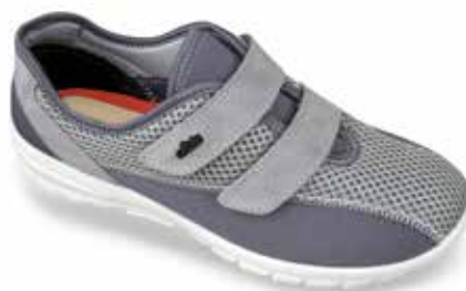
14 MODEL ROZMIAR 517D018 37-42