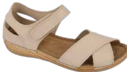
WZÓR ROZMIAR 158D179 36-41