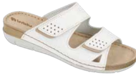
WZÓR ROZMIAR 158D169 36-41