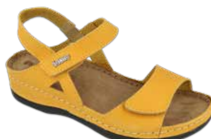
WZÓR ROZMIAR 158D161 36-41