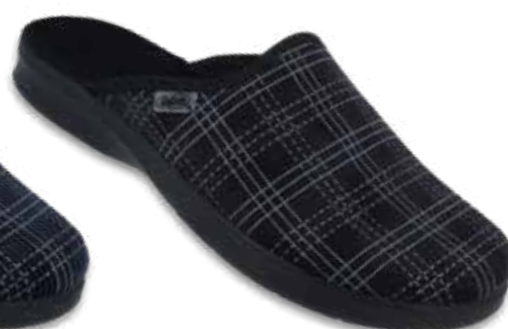
80 | 548M011 39-47 Leon