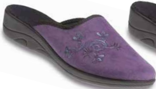
54 552D006 35-41 Jula