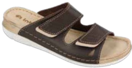
WZÓR ROZMIAR 158D170 36-41