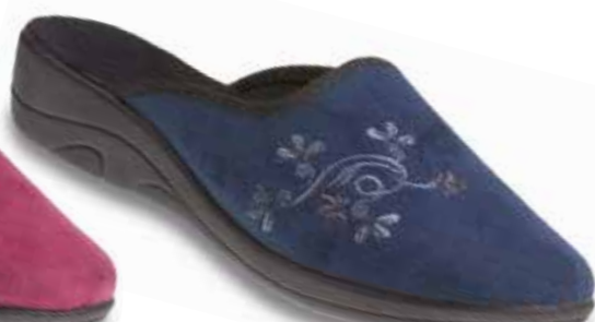
56 552D005 35-41 Jula