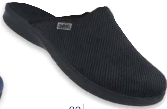
82 | 548M020 39-47 Leon