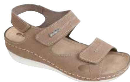
WZÓR ROZMIAR 158D158 36-41