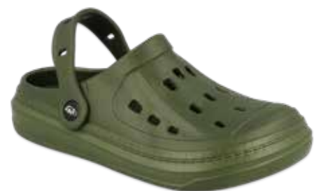
22 MODEL ROZMIAR 154M004 40-45