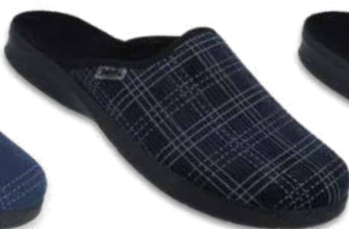
79 | 548M010 39-47 Leon