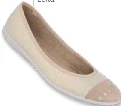
64 | 309Q016 36-40 Lena