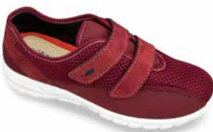
11 MODEL ROZMIAR 517D015 37-42