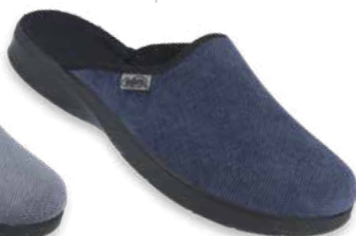
77 | 548M018 39-47 Leon