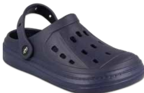
21 MODEL ROZMIAR 154M003 40-45