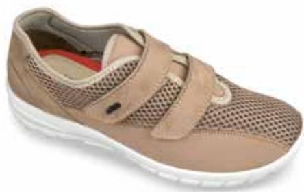
13 MODEL ROZMIAR 517D017 37-42