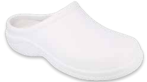
13 MODEL ROZMIAR 154D004 36-41