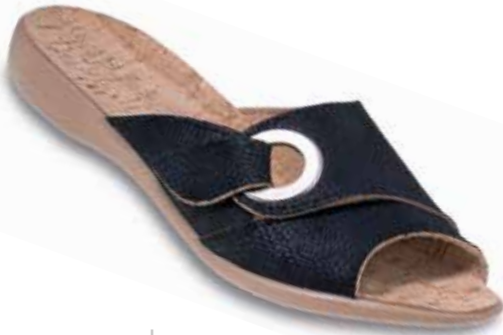
28 265D005 36-41 Viki