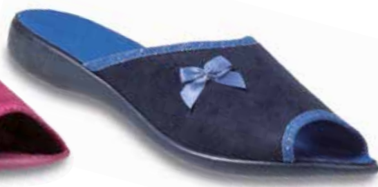
11 254D083 36-41 Viki