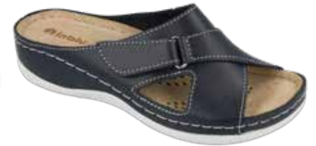
WZÓR ROZMIAR 158D160 36-41