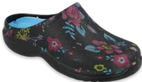
17 MODEL ROZMIAR 154D102 36-41