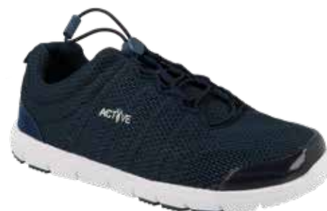
18 MODEL ROZMIAR 517D004 36-41