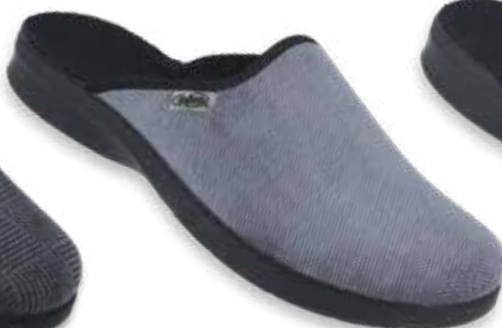
76 | 548M017 39-47 Leon