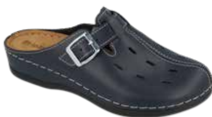
WZÓR ROZMIAR 158D159 36-41