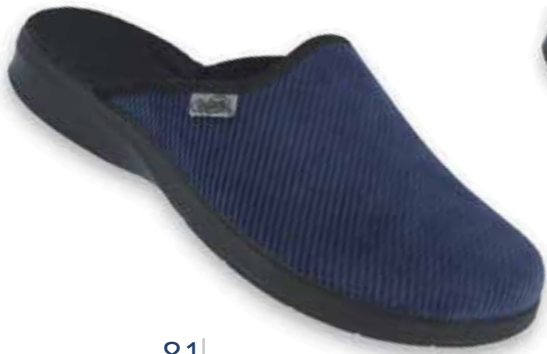
81 | 548M019 39-47 Leon