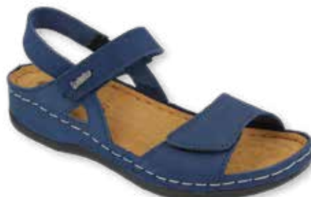
WZÓR ROZMIAR 158D101 36-41