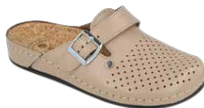
WZÓR ROZMIAR 158D176 36-41