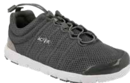
15 MODEL ROZMIAR 517D001 36-41