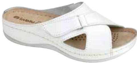
WZÓR ROZMIAR 158D139 36-41