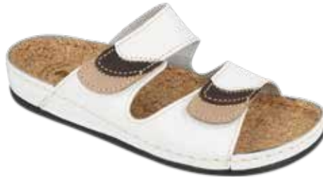
WZÓR ROZMIAR 158D172 36-41