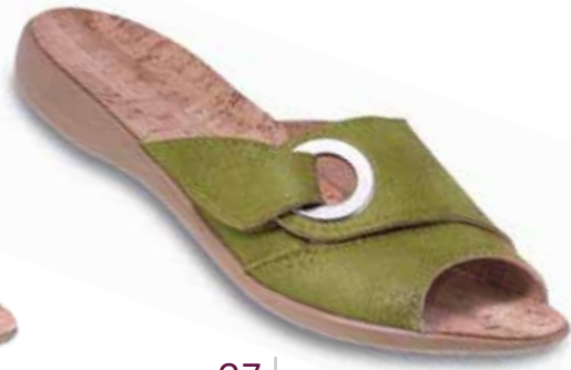
27 265D008 36-41 Viki