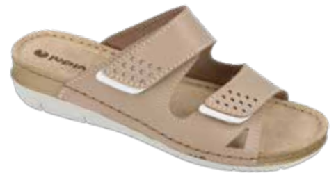
WZÓR ROZMIAR 158D171 36-41