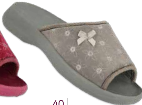
40 | 442D196 36-41 Olivia