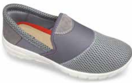
5 MODEL ROZMIAR 517D009 37-42