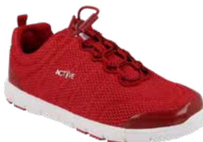
17 MODEL ROZMIAR 517D003 36-41