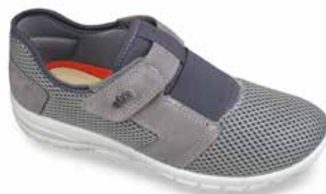
9 MODEL ROZMIAR 517D013 37-42