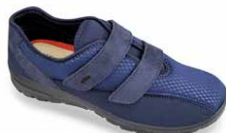
12 MODEL ROZMIAR 517D016 37-42