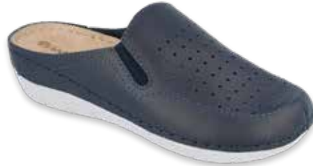
WZÓR ROZMIAR 158D137 36-41