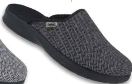
74 | 548M024 39-47 Leon