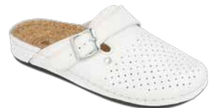
WZÓR ROZMIAR 158D175 36-41