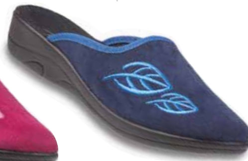
53 552D002 35-41 Jula