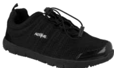
16 MODEL ROZMIAR 517D002 36-41