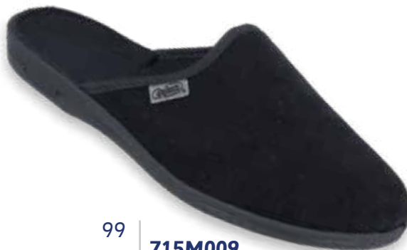
99 | 715M009 39 - 46 Toni