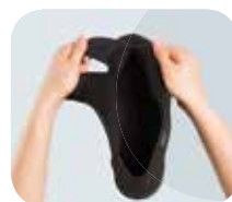
ROZPINANY JĘZYK I PIĘTA