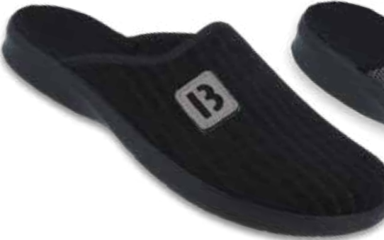
89 | 548M015 39 - 46 Leon