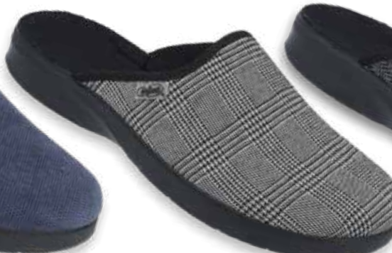
93 | 548M021 39 - 46 Leon