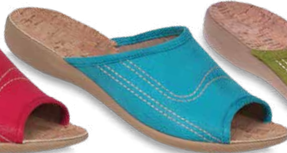
24 | 254D010 36 - 41 Viki