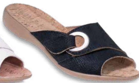
30 | 265D005 36 - 41 Viki