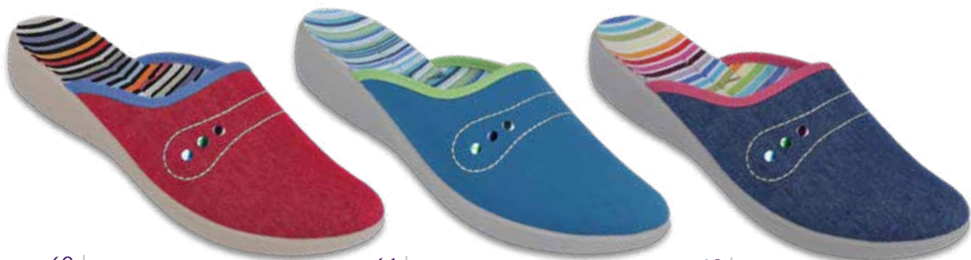
60 | 552D007 35 - 41 Jula