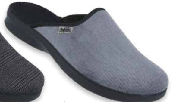
91 | 548M017 39 - 46 Leon