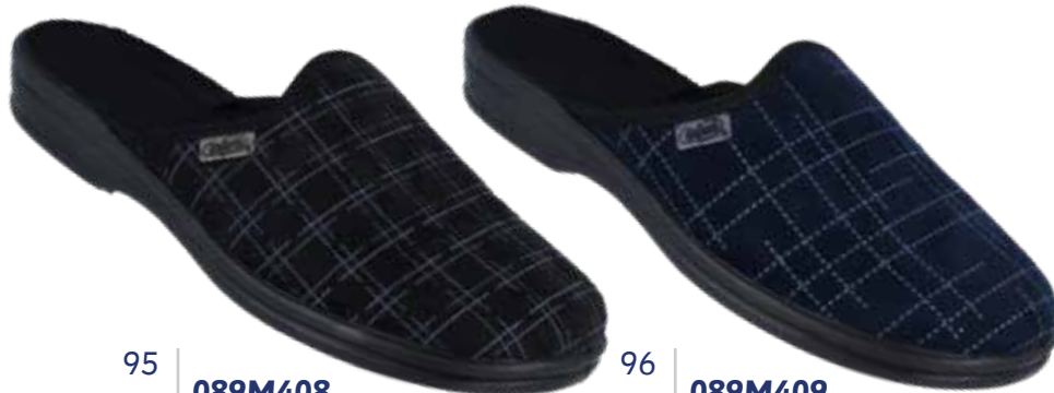
95 | 089M408 39 - 47 Parys