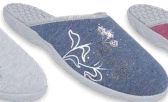
40 | 235D169 36 - 41 Paula