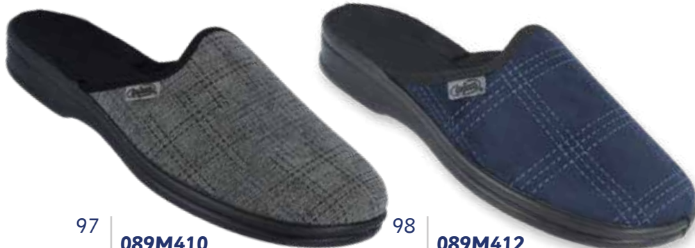
97 | 089M410 39 - 47 Parys