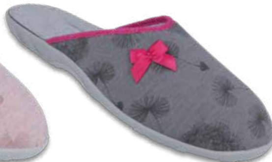
52 | 235D162 36 - 41 Paula