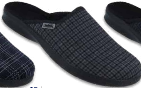
87 | 548M012 39 - 46 Leon