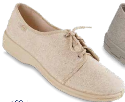
100 | 630M007 39 - 46 Parys