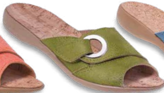
27 | 265D008 36 - 41 Viki