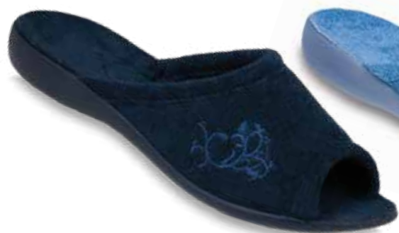
13 | 256D002 36 - 41 Viki