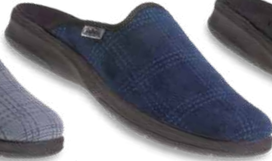
84 | 548M006 39 - 46 Leon