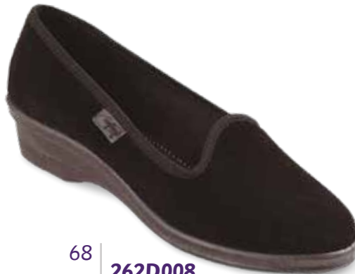
68 | 262D008 36 - 41 Kaja