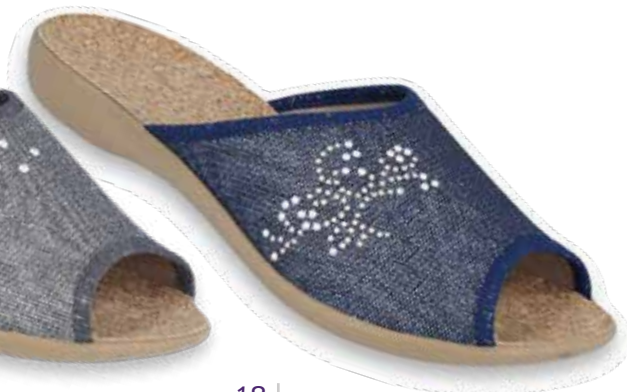
18 | 254D107 36 - 41 Viki