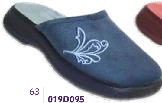
63 | 019D095 35 - 41 Olivia