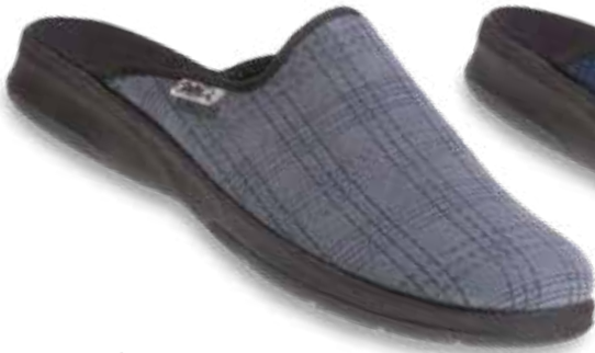
83 | 548M002 39 - 46 Leon