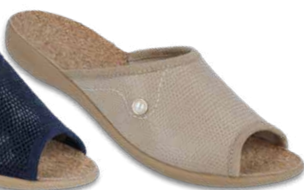
21 | 254D094 36 - 41 Viki