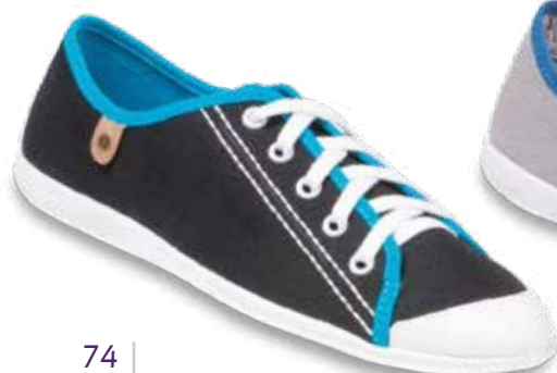
74 | 248Q019 36 - 40 Lena