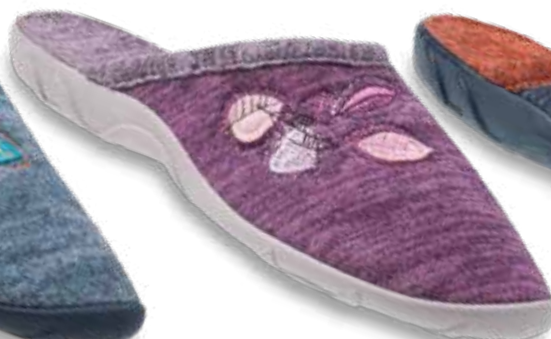
43 | 235D152 36 - 41 Paula