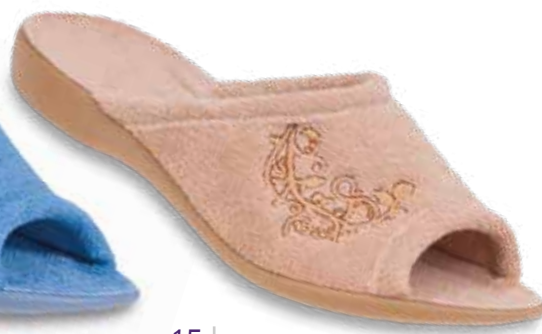
15 | 256D013 36 - 41 Viki