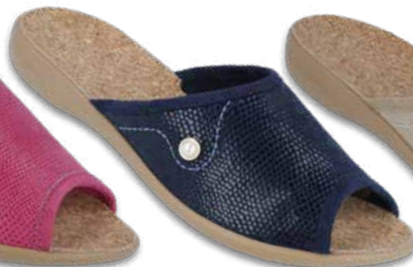
20 | 254D093 36 - 41 Viki