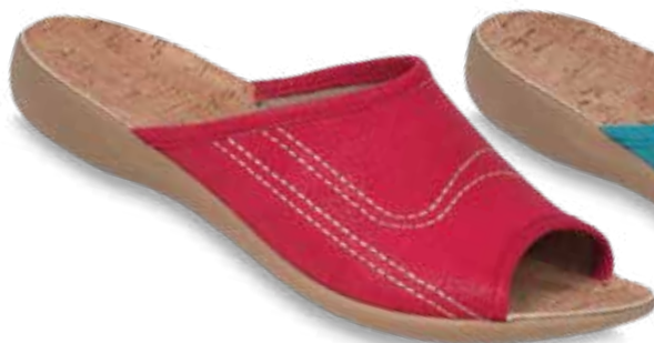
23 | 254D008 36 - 41 Viki