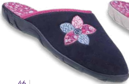
46 | 235D154 36 - 41 Paula