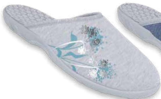
39 | 235D168 36 - 41 Paula