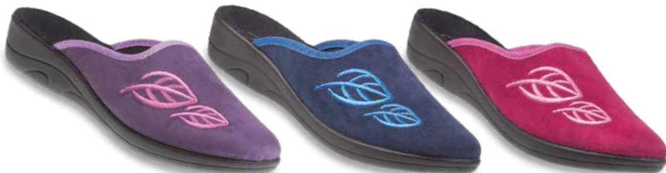
54 | 552D001 35 - 41 Jula