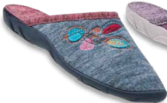
42 | 235D151 36 - 41 Paula