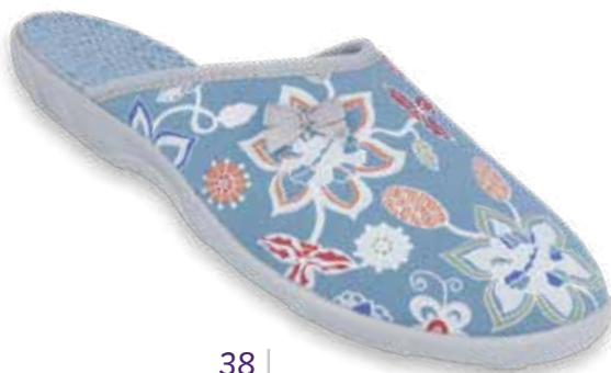
38 | 235D167 36 - 41 Paula