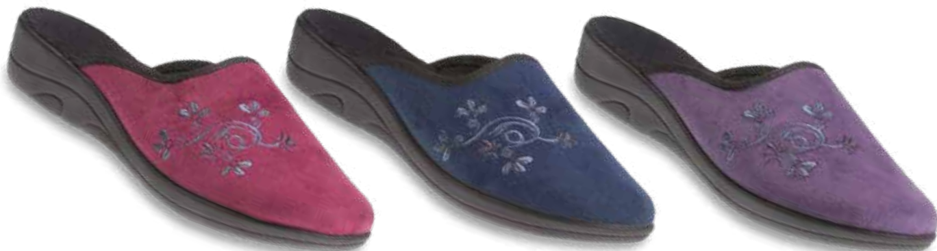
57 | 552D004 35 - 41 Jula