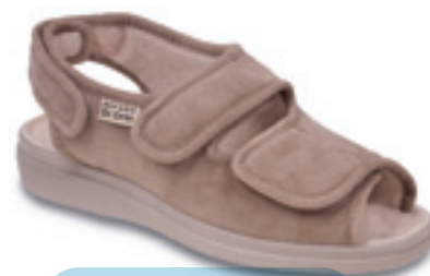
28 Wzór: 676D004