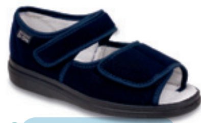
30 Wzór: 989D002