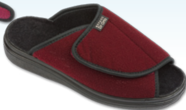
Rozpinany język i pięta