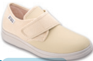
19 Wzór: 036D005