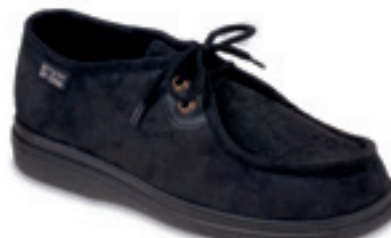
25 Wzór: 871D004