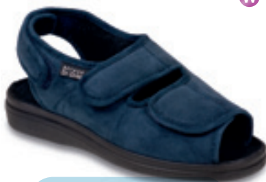
27 Wzór: 676D003