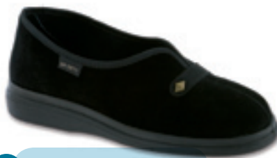
12 Wzór: 536A005