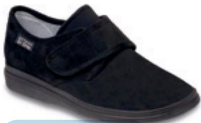
21 Wzór: 036D007