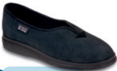
11 Wzór: 057D028