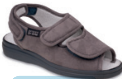
29 Wzór: 676D006