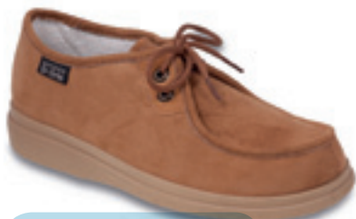
26 Wzór: 871D005