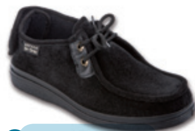
23 Wzór: 387D004