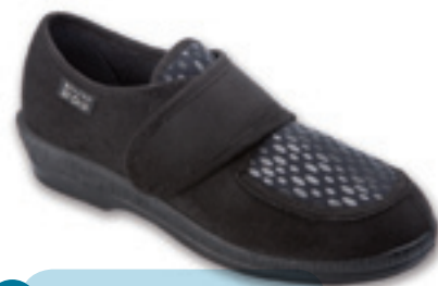
13 Wzór: 984D001