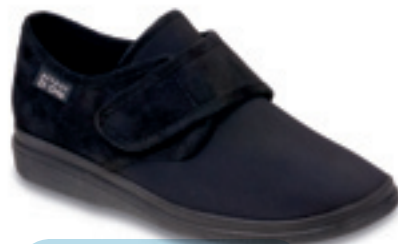
20 Wzór: 036D006