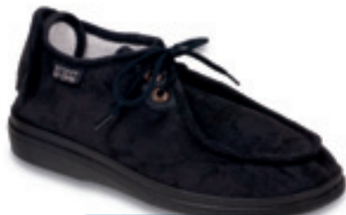
24 Wzór: 387D005