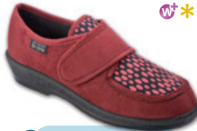
15 Wzór: 984D003