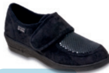
18 Wzór: 984D012