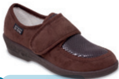
16 Wzór: 984D010