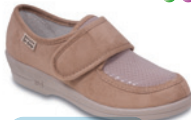
17 Wzór: 984D011