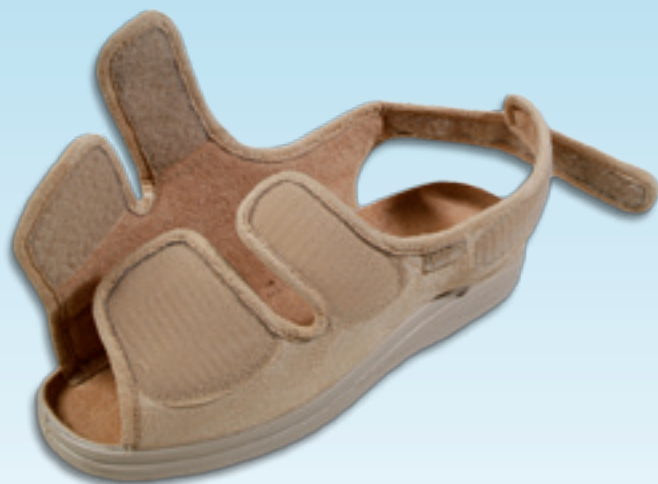
Elementy całkowicie rozpinane

W fazie projektowania obuwia kierowano się potrzebami przyszłych użytkowników. Sznurowanie, zapinanie na rzepy oraz zamki błyskawiczne pozwalają na łatwe wżuwanie butów. Z uwagi na konstrukcję, obuwie to pozwala na dokładne dopasowanie cholewki do stóp o różnych tęgościach.