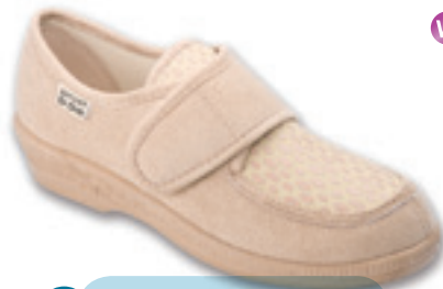
14 Wzór: 984D002