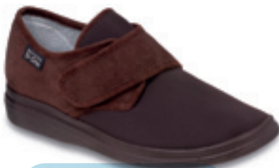
22 Wzór: 036D008