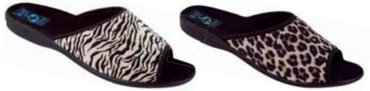
84 art. 15773 BZ/CZ