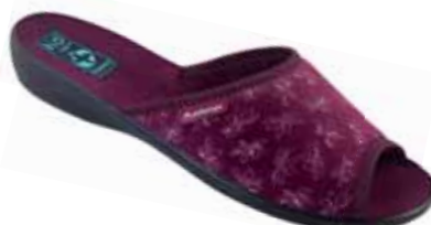
40 art. 23662 BU/CZ