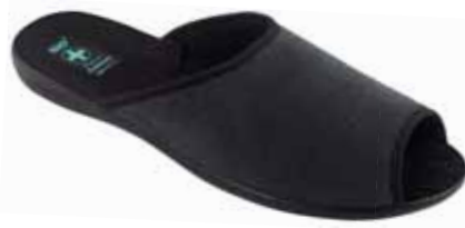
214 art. 26848 SZ/CZ