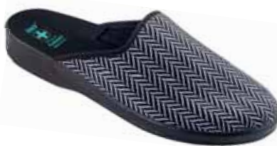
236 art. 25147 CZ/CZ