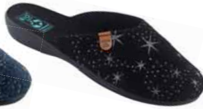
72 art. 26829 CZ/CZ