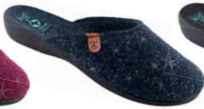
71 art. 26831 GR/CZ