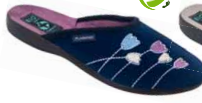
124 art. 25626 GR/CZ