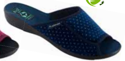
37 art. 26682 GR/CZ