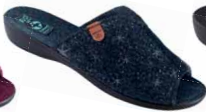
43 art. 26834 GR/CZ