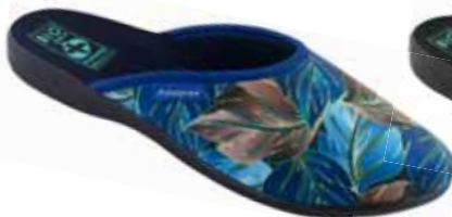
119 art. 26777 NI/CZ