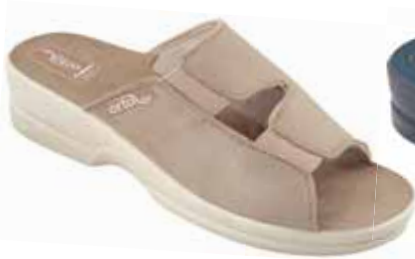
5 art. 26186 BZ/BZ