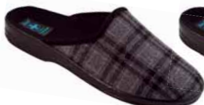
242 art. 18464 SZ/CZ