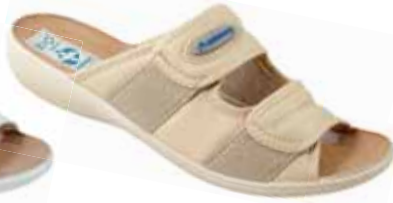
27 art. 17660 BZ/BZ