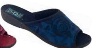
39 art. 25392 GR/CZ