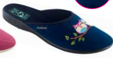
123 art. 26594 GR/CZ