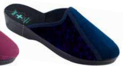
209 art. 26818 GR/CZ