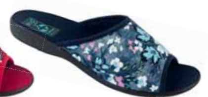
77 art. 25365 GR/CZ