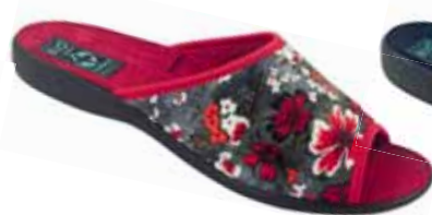
76 art. 25363 BO/CZ