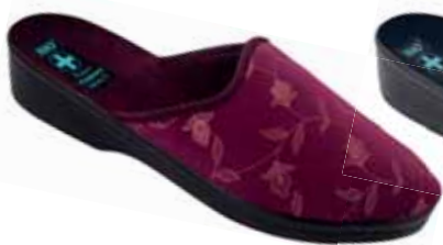
206 art. 18565 BU/CZ