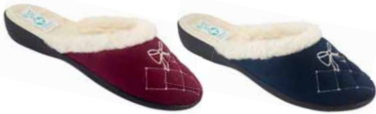
66 art. 25614 BO/CZ