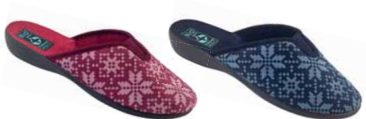
61 art. 25407 BO/CZ