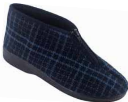
246 art. 26812 GR/CZ