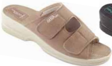
8 art. 26184 BZ/BZ