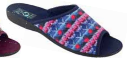
81 art. 25603 GR/CZ