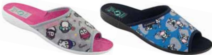
90 art. 26794 KOI/SZJ