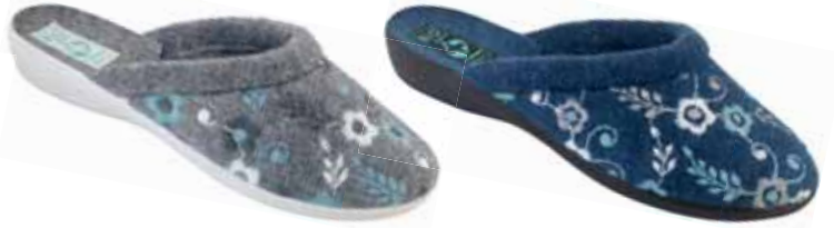
68 art. 25543 SZ/SZJ