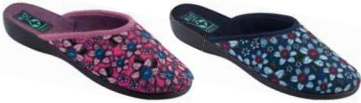
53 art. 26670 RO/CZ