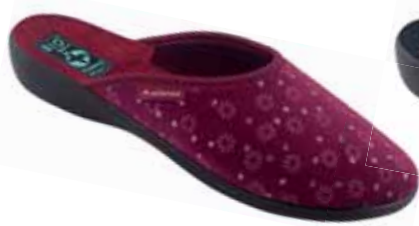
50 art. 26724 BO/CZ