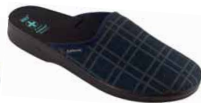
237 art. 26801 GR/CZ