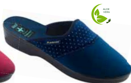
211 art. 26684 GR/CZ