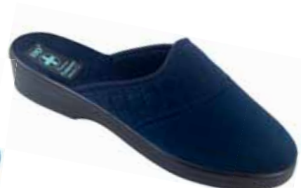
212 art. 25360 GR/CZ