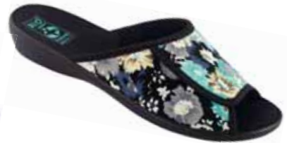
33 art. 23046 TU/CZ