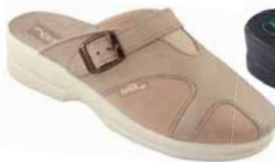
10 art. 25126 BZ/BZ