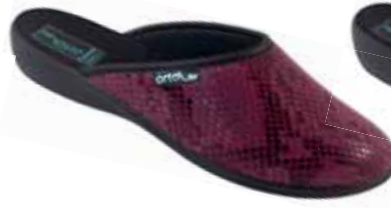
3 art. 25530 B0/CZ