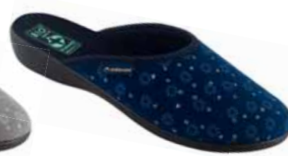
52 art. 26723 GR/CZ