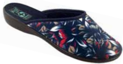
57 art. 24304 GR/CZ