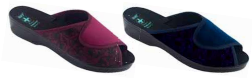
201 art. 26819 BU/CZ