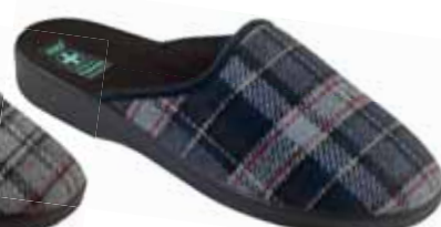
241 art. 24161 GR/CZ