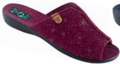
42 art. 26833 BO/CZ