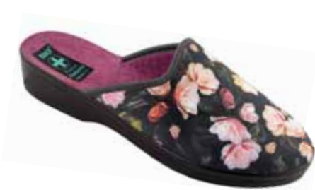
203 art. 26783 CZ/CZ