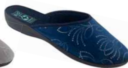
49 art. 25424 GR/CZ