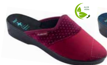
210 art. 26685 BO/CZ