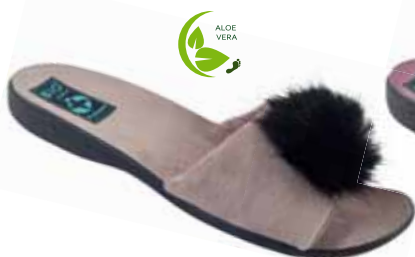
94 art. 25695 RS/CZ