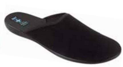
222 art. 21115 CZ/CZ