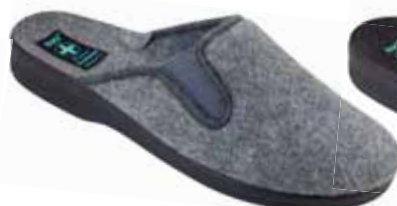
244 art. 25582 SZ/CZ