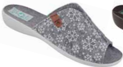
45 art. 24217 SZ/SZ