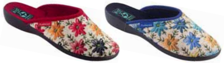
55 art. 26742 MA/CZ