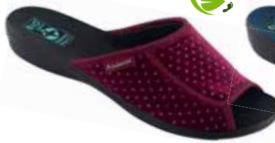
36 art. 26683 BO/CZ