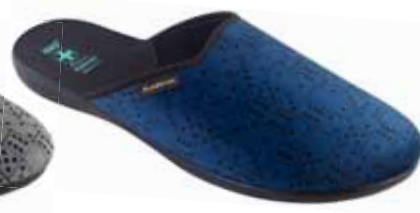
219 art. 26650 GR/CZ