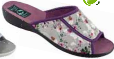
35 art. 26765 SZJ/CZ