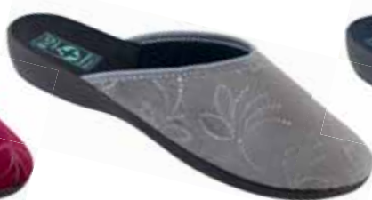
48 art. 25416 SZ/CZ