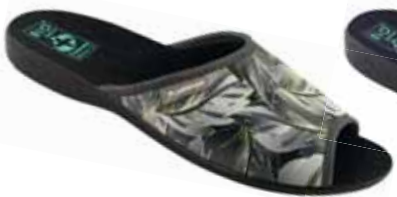
74 art. 26776 SZ/CZ