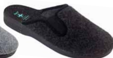
245 art. 25581 SZ/CZ