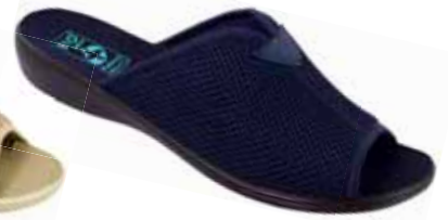
29 art. 20024 GR/CZ