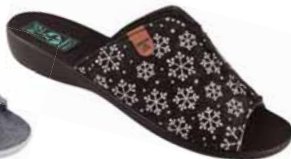
46 art. 24218 CZ/CZ