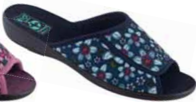
31 art. 26666 GR/CZ