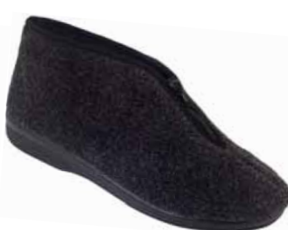
247 art. 22530 SZ/CZ