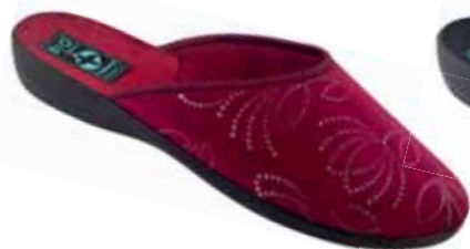
47 art. 25420 BO/CZ