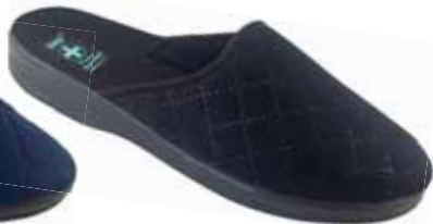
235 art. 25357 CZ/CZ