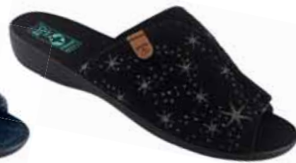
44 art. 26832 CZ/CZ