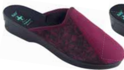
208 art. 26817 BU/CZ