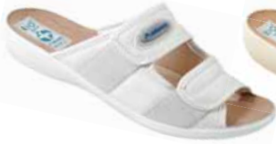
26 art. 17659 BI/BI.L