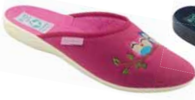
122 art. 26593 RO/BZ