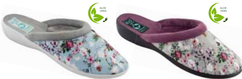
63 art. 26763 NI/SZJ