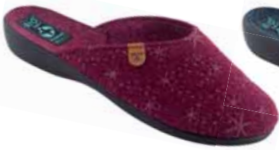
70 art. 26830 BO/CZ