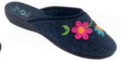
73 art. 25657 GR/CZ