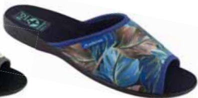
75 art. 26773 NI/CZ