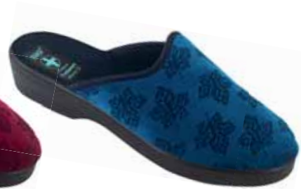
205 art. 25595 GR/CZ