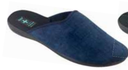
215 art. 25434 GR/CZ