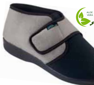
12 art. 25587 SZCZ/CZ