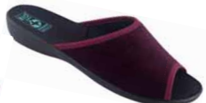
41 art. 26836 BO/CZ