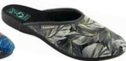
120 art. 26780 SZ/CZ