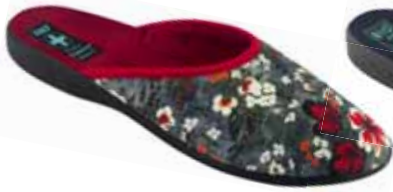
112 art. 26871 BO/CZ