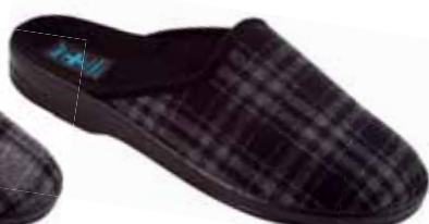
243 art. 18463 CZ/CZ