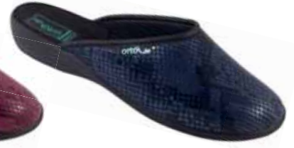
4 art. 25529 GR/CZ