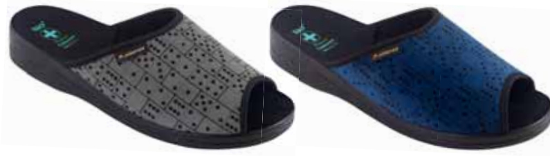
14 art. 26646 SZ/CZ