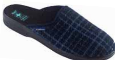
239 art. 26720 GR/CZ