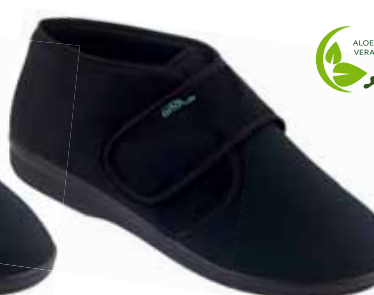
13 art. 25586 CZ/CZ