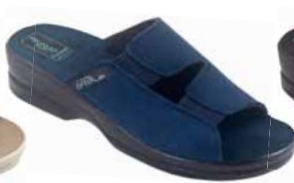
6 art. 26187 GR/CZ