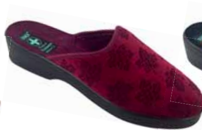
204 art. 25594 BO/CZ