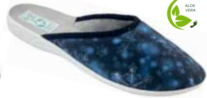
118 art. 25520 GR/SZJ