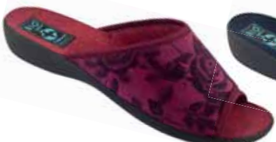
38 art. 25396 BU/CZ