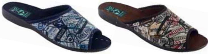
82 art. 26709 GR/CZ