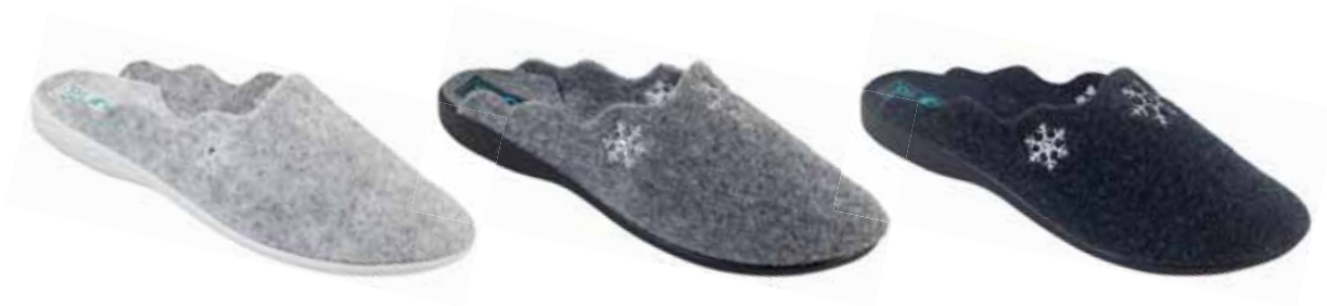
147 art. 25686 BI/SZJ