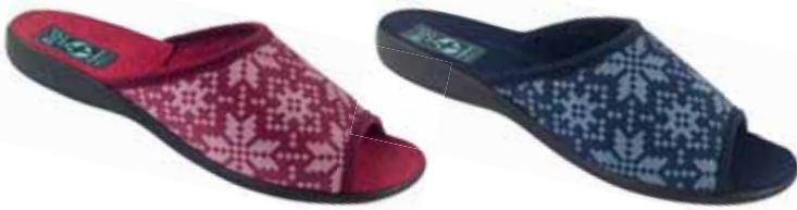
86 art. 25410 BO/CZ