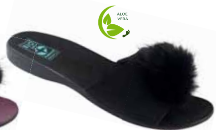
96 art. 25696 CZ/CZ