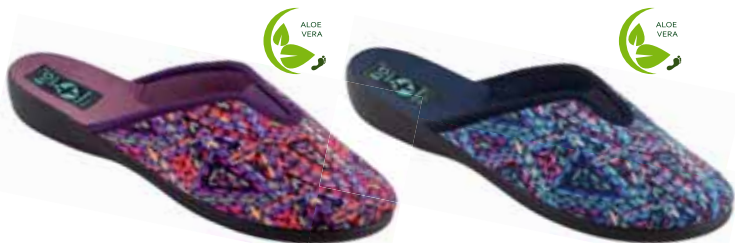
59 art. 26706 FI/CZ