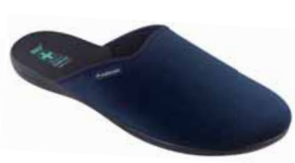
217 art. 26656 GR/CZ