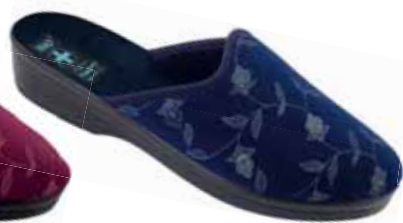
207 art. 18567 GR/CZ