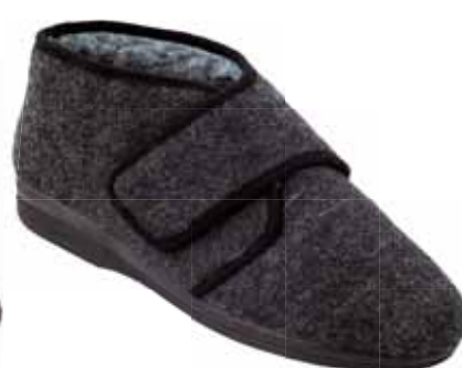
248 art. 11898 SZ/CZ