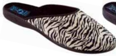
114 art. 15819 BZ/CZ