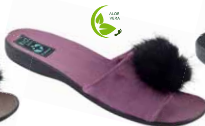
95 art. 25694 RC/CZ