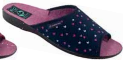
79 art. 26642 GR/CZ