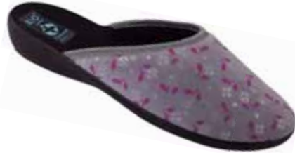
58 art. 22340 SZ/CZ