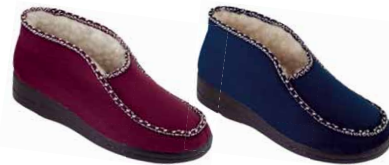
24 art. 17013 BO/CZ