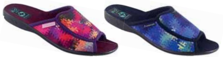
88 art. 26265 RO/CZ