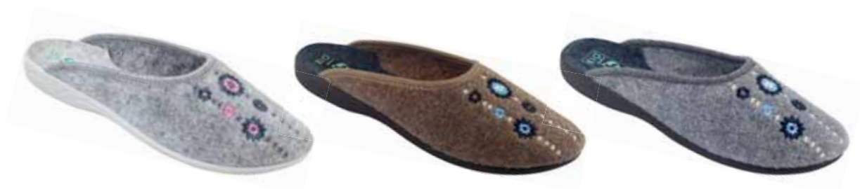
144 art. 25683 BI/SZJ