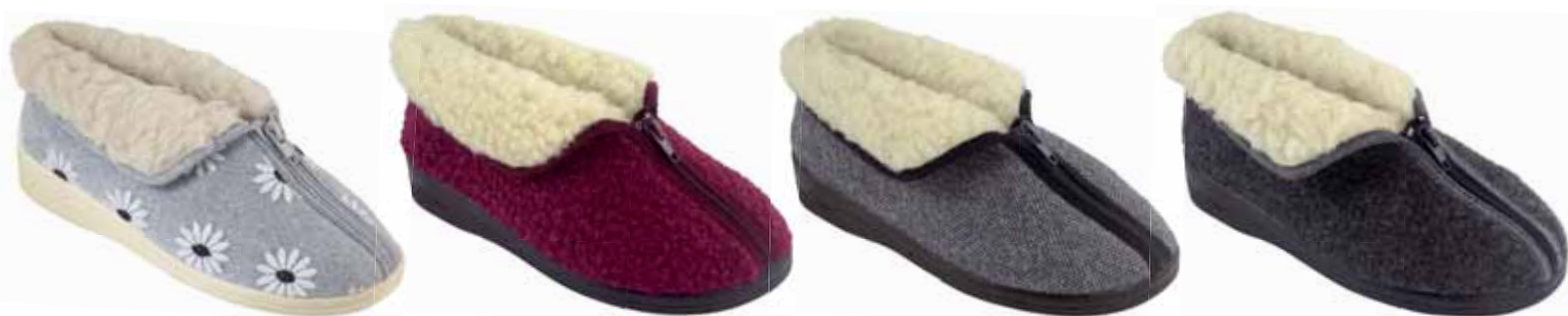
20 art. 24477 SZ/BZ