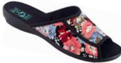
32 art. 26843 NI/CZ