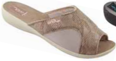
1 art. 26180 BZ/BZ