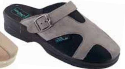
11 art. 25125 SZCZ/CZ