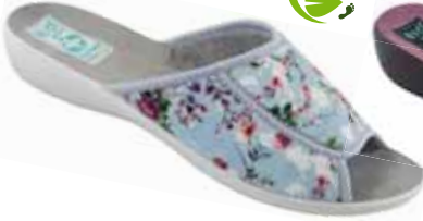
34 art. 26766 NI/SZJ