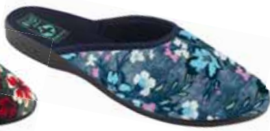
113 art. 26870 GR/CZ