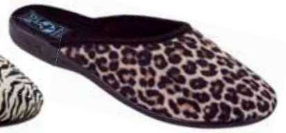
115 art. 16883 BZ/CZ