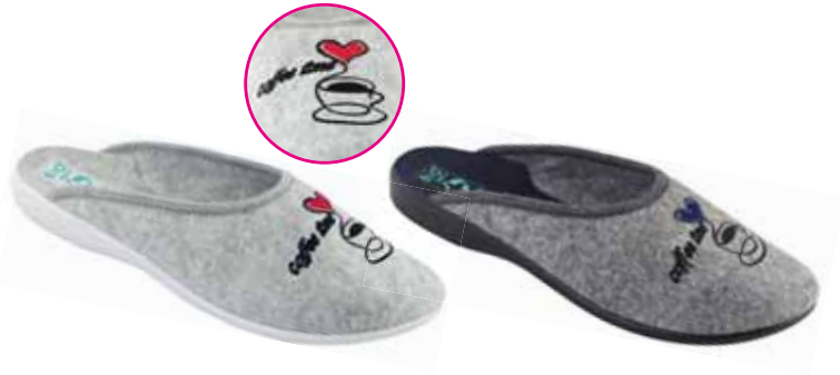
139 art. 26589 BI/SZJ