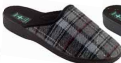
240 art. 24162 SZ/CZ