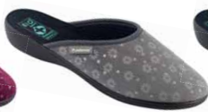
51 art. 26725 SZ/CZ