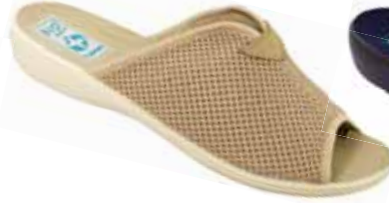
28 art. 20026 BZ/BZ