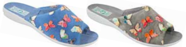
92 art. 25373 NI/SZJ