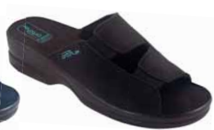
7 art. 26188 CZ/CZ