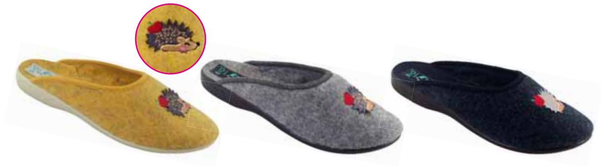
141 art. 26597 ZO/BZ