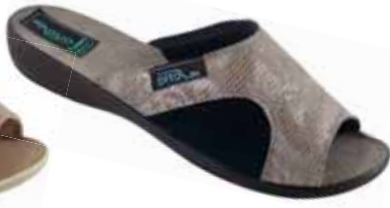
2 art. 26181 SZ/CZ