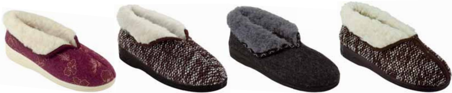
16 art. 21054 BO/BZ