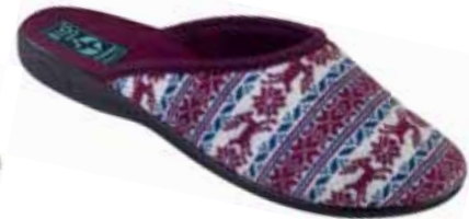
121 art. 23467 BO/CZ