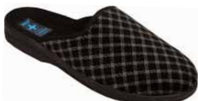
238 art. 2641 CZ/CZ