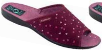
78 art. 26643 BO/CZ