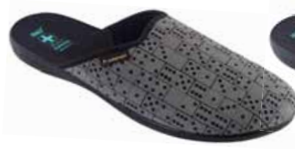
218 art. 26649 SZ/CZ