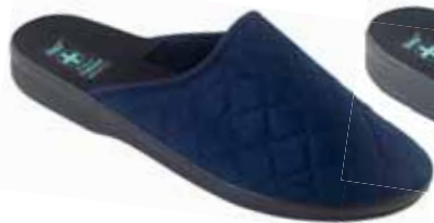
234 art. 25358 GR/CZ