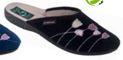
125 art. 25625 CZ/CZ