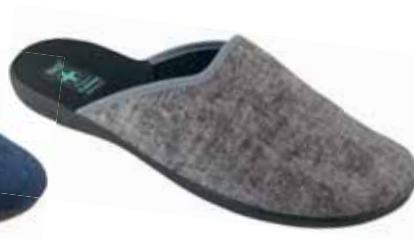
216 art. 25433 SZ/CZ