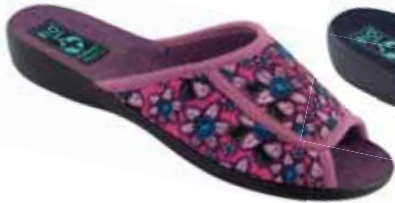
30 art. 26667 RO/CZ