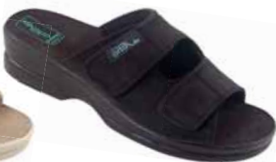
9 art. 26185 CZ/CZ