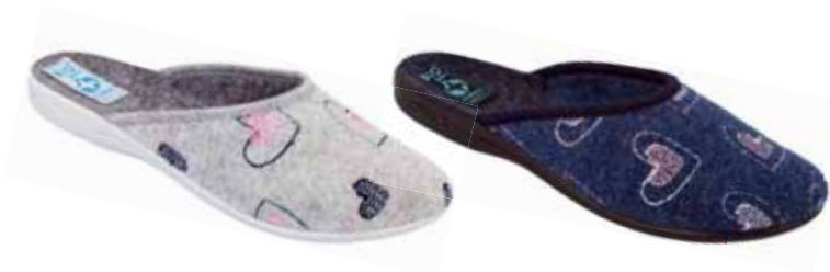
137 art. 19255 SZ/SZJ