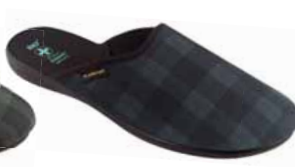
221 art. 26816 SZ/CZ