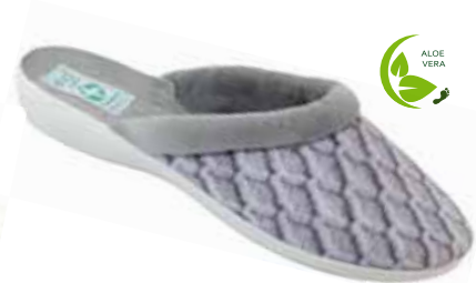
65 art. 25576 SZJ/SZJ