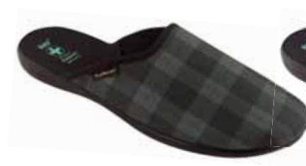
220 art. 26815 SZ/CZ