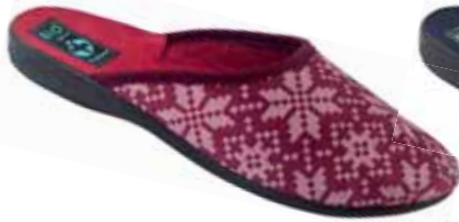
116 art. 25409 BO/CZ