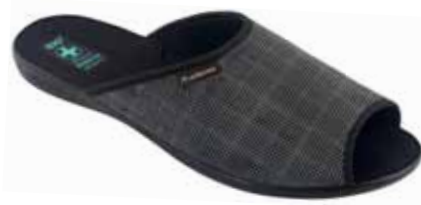
213 art. 26659 SZ/CZ