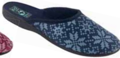
117 art. 25405 GR/CZ