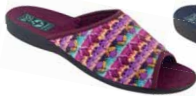
80 art. 25604 FI/CZ