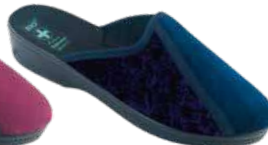
234 art. 26818 GR/CZ KR