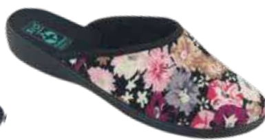
109 art. 26841 BU/CZ