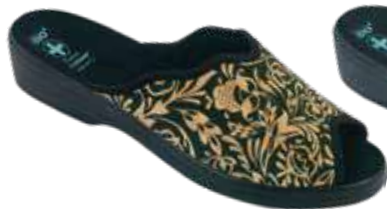
227 art. 29520 CZZK/CZ