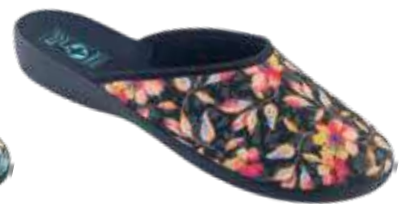
111 art. 28010 PO/CZ