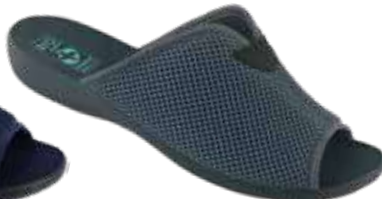
66 art. 27973 SZC/CZ