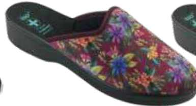
229 art. 28824 BU/CZ