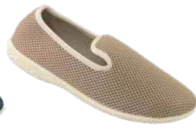
145 art. 29472 BZ/BZ