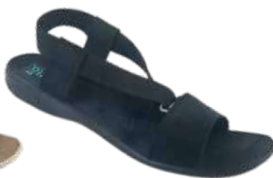
136 art. 28803 CZ/CZ