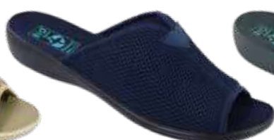
65 art. 20024 GR/CZ KR