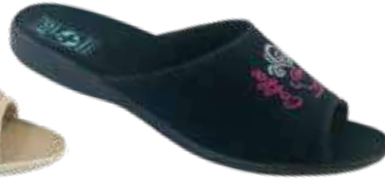
164 art. 29624 CZ/CZ