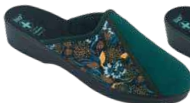
231 art. 29532 MO/CZ