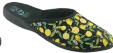
172 art. 28800 CZ/CZ