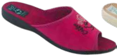
162 art. 29622 MA/CZ