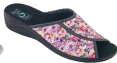
194 art. 29529 KOL/CZ