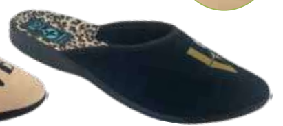
169 art. 28910 CZ/CZ