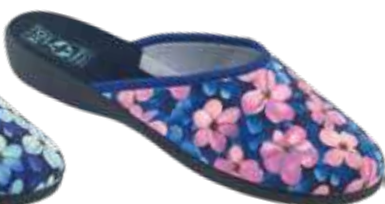
117 art. 29516 RO/CZ