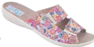
62 art. 29494 KOL/BZ