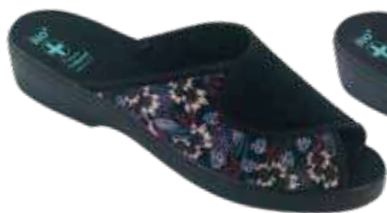
223 art. 29534 CZRC/CZ