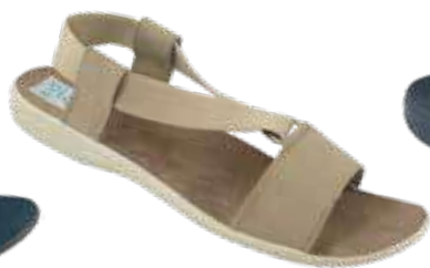
135 art. 28819 BZ/BZ