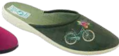
167 art. 29618 ZC/BZ