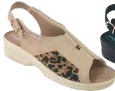
29 art. 29650 BZ/BZ