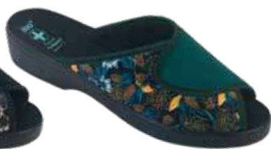
224 art. 29531 MO/CZ