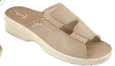
22 art. 26186 BZ/BZ KR