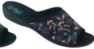
106 art. 29536 RO/CZ