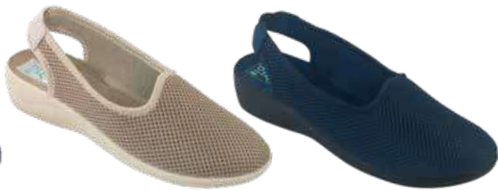
189 art. 29474 BZ/BZ