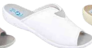
70 art. 20210 BI/BI