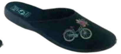
165 art. 29615 CZ/CZ