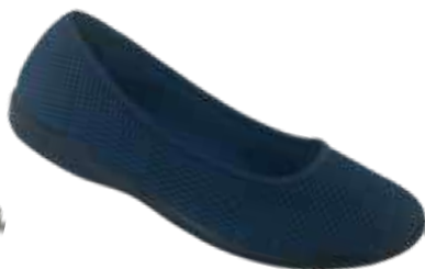
140 art. 29475 GR/CZ