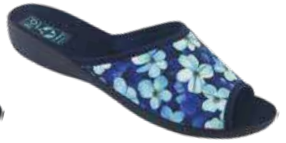
107 art. 29513 NI/CZ