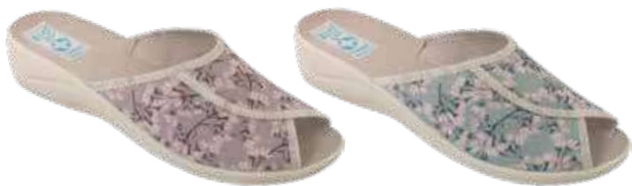
191 art. 29538 KA/BZ