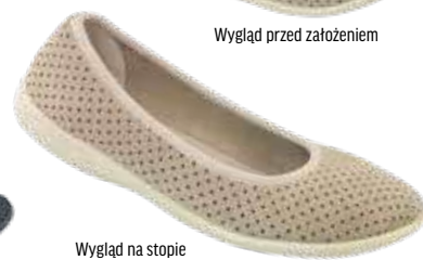
Wygląd na stopie