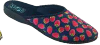
173 art. 29512 GR/CZ