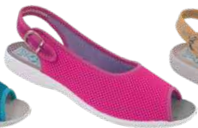
131 art. 29549 RO/SZJ