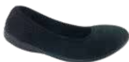
Wygląd przed założeniem