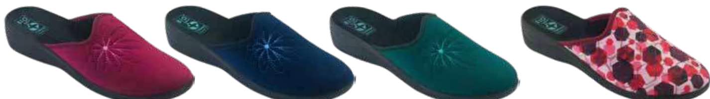
199 art. 29612 B0/CZ