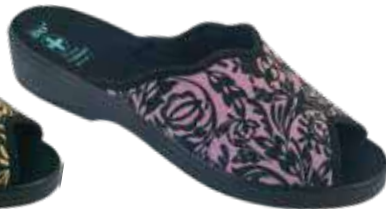
228 art. 29517 RS/CZ