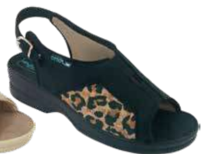
30 art. 29645 BZCZ/CZ