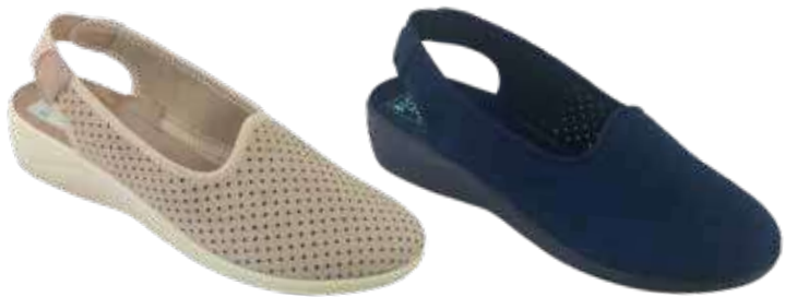
187 art. 29573 BZ/BZ