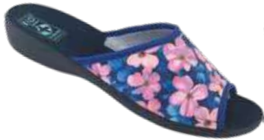
108 art. 29515 RO/CZ