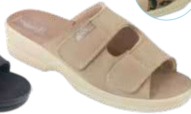
21 art. 29647 BZ/BZ