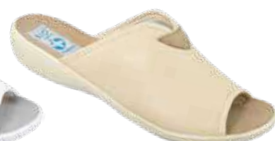
71 art. 20028 BZJ/BZ