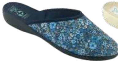
112 art. 28768 GR/CZ