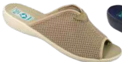
64 art. 20026 BZC/BZ KR