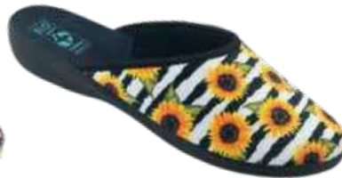
114 art. 28827 ZO/CZ