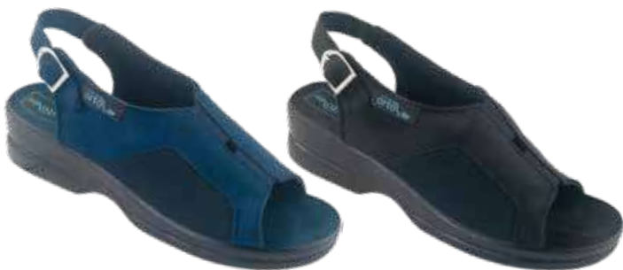
27 art. 24781 GR/CZ