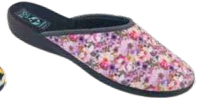
115 art. 29528 KOŁ/CZ