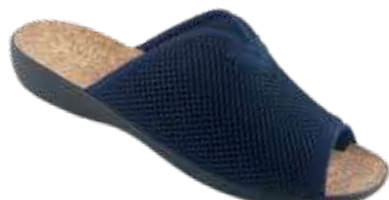
68 art. 26008 GR/CZ