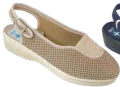
219 art. 22880 BZC/BZ