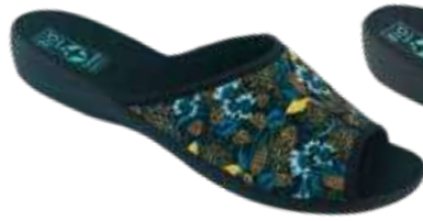
105 art. 29533 MO/CZ