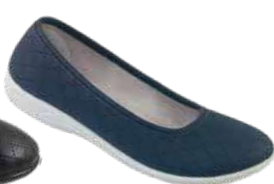
144 art. 29576 GRS/SZJ