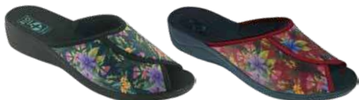
195 art. 28822 CZ/CZ