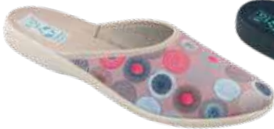
170 art. 29508 BZ/BZ