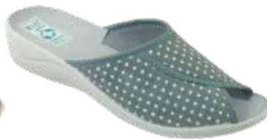
193 art. 28860 SZ/SZJ