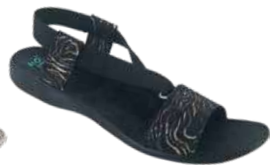
133 art. 29057 CZ/CZ