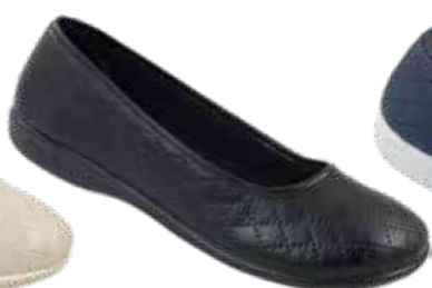
143 art. 18699 CZ/CZ