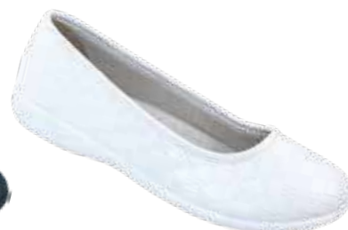
141 art. 18820 BI/BI