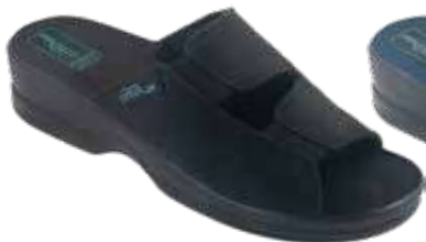
23 art. 26188 CZ/CZ