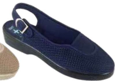
220 art. 22885 GR/CZ