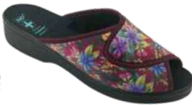
221 art. 28823 BU/CZ