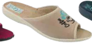
163 art. 29623 BZ/BZ