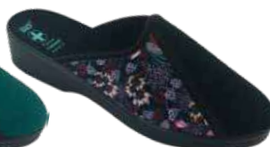
232 art. 29535 CZRC/CZ