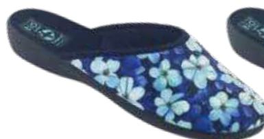
116 art. 29514 NI/CZ