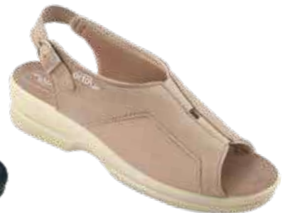
26 art. 26189 BZ/BZ