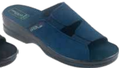
24 art. 26187 GR/CZ