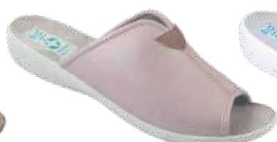
69 art. 28749 ROJ/SZJ