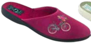
166 art. 29616 MA/CZ