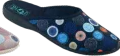
171 art. 29510 GR/CZ