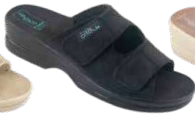
20 art. 26185 CZ/CZ