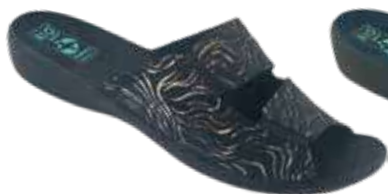
60 art. 29058 CZ/CZ

☑ Very lightweight and flexible sole, ensuring full freedom of movement of the foot. The increased width of the upper, allows better shoe fitting also for people with foot problems, such as hallux valgus.