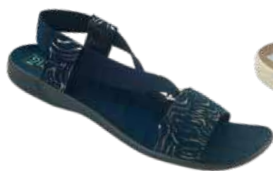
134 art. 29061 GR/CZ