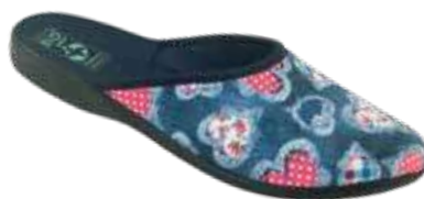
174 art. 28805 GR/CZ