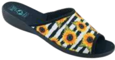
104 art. 28826 ZO/CZ