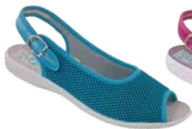
130 art. 29563 MO/SZJ