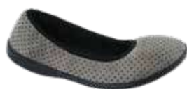
Wygląd przed założeniem