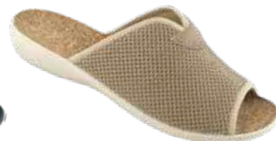
67 art. 26009 BZC/BZ