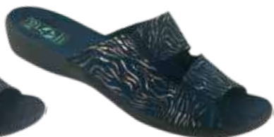
61 art. 29062 GR/CZ