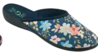
110 art. 28762 GR/CZ