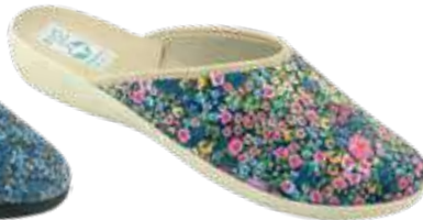
113 art. 28766 KOŁ/BZ