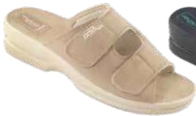
19 art. 26184 BZ/BZ

☒ ASTRA sole with its anatomical profile, the recess in the heel part and with a wide heel ensuring good stabilization. Adequate thickness separates the foot from the unevenness of the ground, and its lightness ensures high comfort of use.