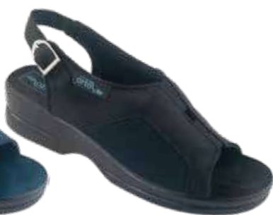
28 art. 26191 CZ/CZ KR