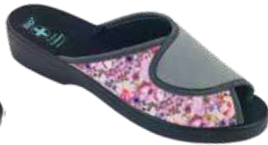
222 art. 29530 SZKOL/CZ