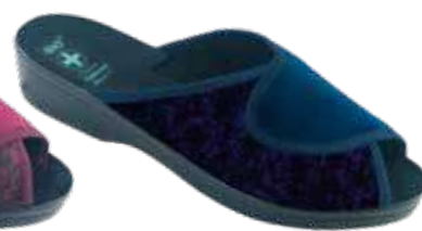
226 art. 26820 GR/CZ KR