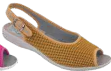
132 art. 29554 ZO/SZJ