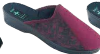
233 art. 26817 BU/CZ KR