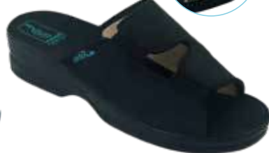
25 art. 29644 BZCZ/CZ