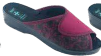
225 art. 26819 BU/CZ KR