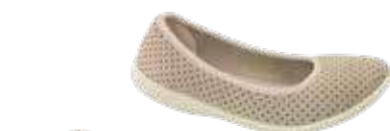
Wygląd przed założeniem