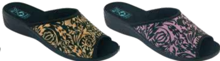
197 art. 29521 CZZŁ/CZ