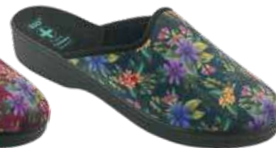
230 art. 28821 CZ/CZ