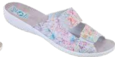
63 art. 29503 BI/BI