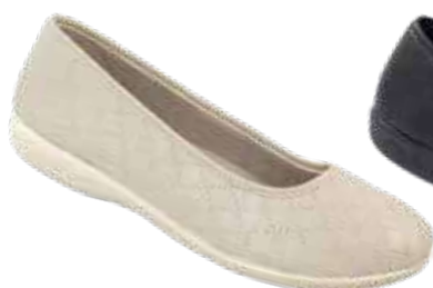
142 art. 18696 BZ/BZ