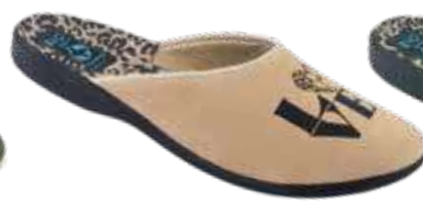
168 art. 28909 BZ/CZ