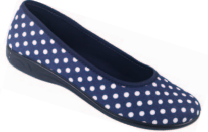
65 art. 23026 GR/BI/CZ