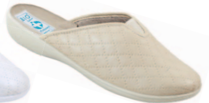
27 art. 18720 BZ/BZ