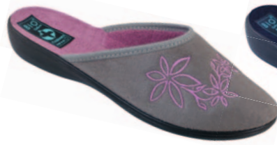
22 art. 23933 SZ/CZ