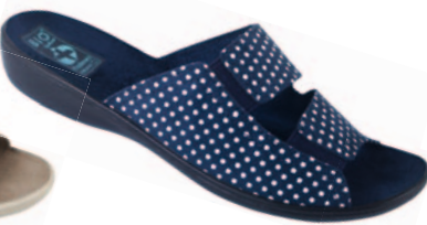
10 art. 23051 GR/CZ