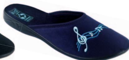
57 art. 23951 GR/CZ