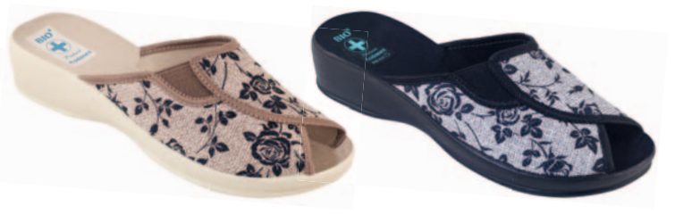
76 art. 23870 BZC/BZ