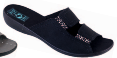
12 art. 23892 CZ/CZ