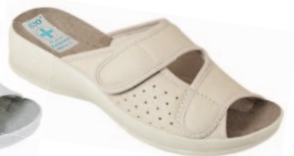
69 art. 22870 BZ/BZ