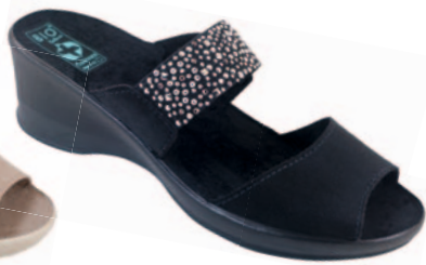
99 art. 23854 CZ/CZ