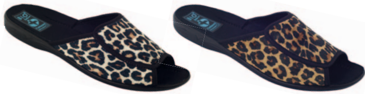
47 art. 13795 BI/CZ