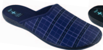
143 art. 23965 GR/CZ