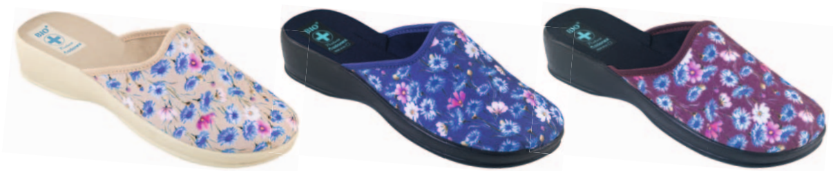
84 art. 23997 BZ/BZ