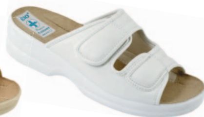
106 art. 16545 BI/BI.L