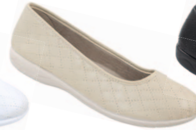
63 art. 18696 BZ/BZ