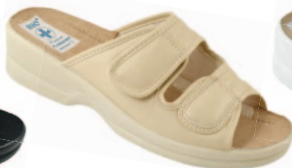
105 art. 16721 BZJ/BZ