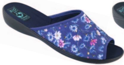
17 art. 23992 GR/CZ