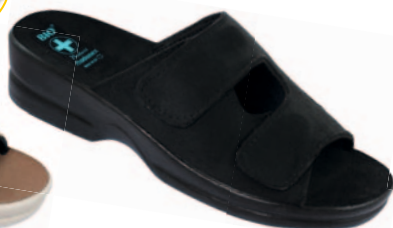
108 art. 20406 CZ/CZ