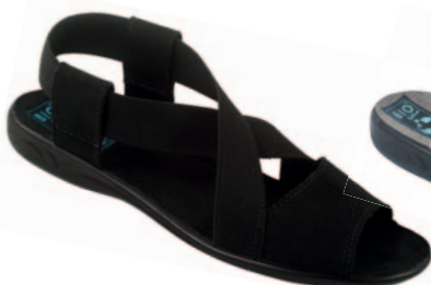
28 art. 17498 CZ/CZ