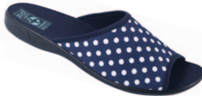
40 art. 22997 GRBI/CZ