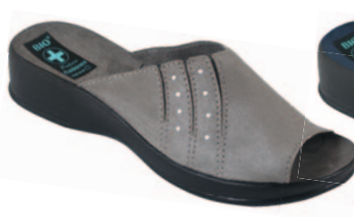
72 art. 23074 SZ/CZ