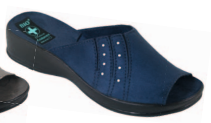
73 art. 23073 GR/CZ