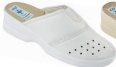
109 art. 16717 BI/BI.L