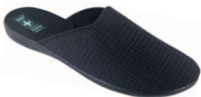
146 art. 23113 BR/CZ