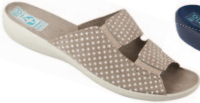
9 art. 22862 BZ/BZ