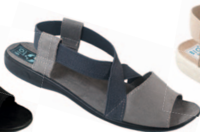
29 art. 23020 SZ/CZ