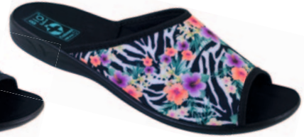
38 art. 23876 RC/CZ