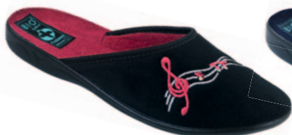
56 art. 23953 CZ/CZ