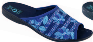
41 art. 23863 NC/CZ