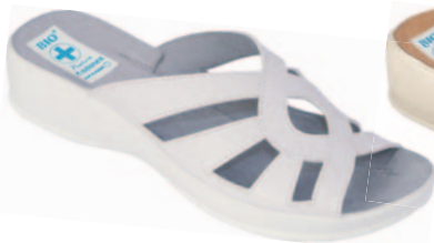
66 art. 11444 BI/BI.L