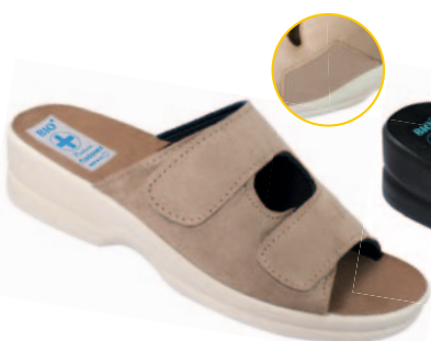
107 art. 20407 BZ/BZ