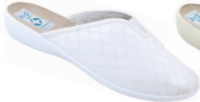
26 art. 18783 BI/BI.L