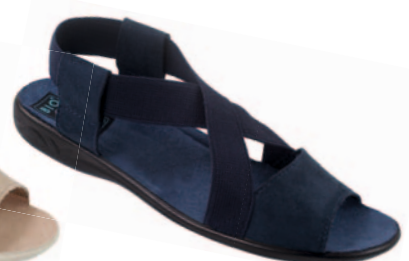
31 art. 17497 GR/CZ