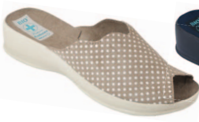
70 art. 22972 BZ/BZ