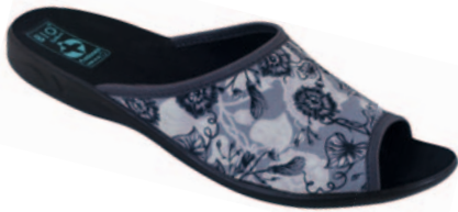
36 art. 23981 SZ/CZ