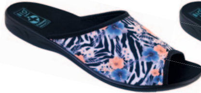
37 art. 23877 NC/CZ