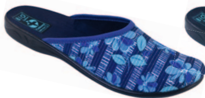
53 art. 23860 NC/CZ