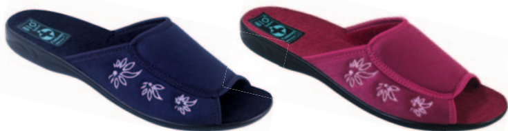
49 art. 23928 GR/CZ