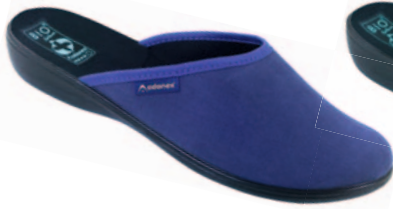
20 art. 23905 GR/CZ