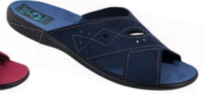
35 art. 18798 GR/CZ