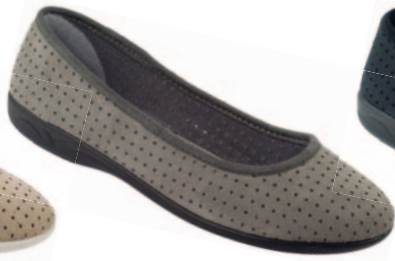
59 art. 16426 SZ/CZ