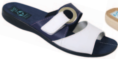
32 art. 22827 BGR/CZ