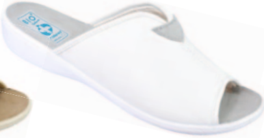
6 art. 20210 BI/BI.L