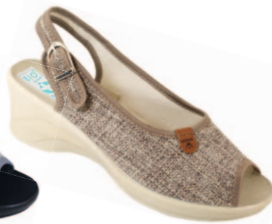
101 art. 22906 BZC/BZ