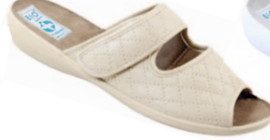
3 art. 18701 BZ/BZ