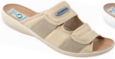
1 art. 17660 BZ/BZ