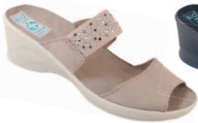
98 art. 23855 BZ/BZ