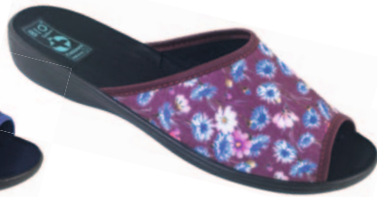
18 art. 23990 BU/CZ