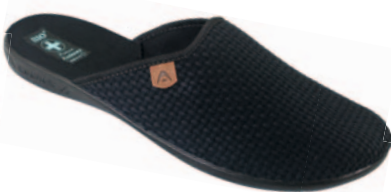
145 art. 22931 CZ/CZ