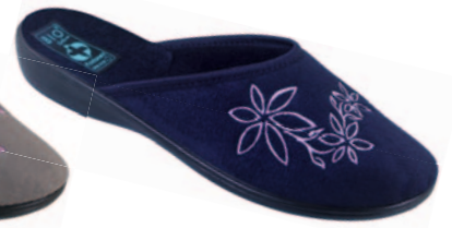
23 art. 23931 GR/CZ