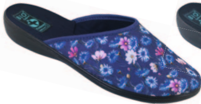
24 art. 23989 GR/CZ