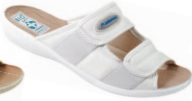
2 art. 17659 BI/BI.L