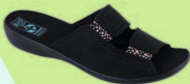
DIANA MODEL DIK13 - STRONA 3

Klapki wyjściowe na podszwie Diana, ozdobione cekinami w części bocznej. Dzięki podwójnej regulacji oraz podwyższonej tężości, doskonale dopasowują się do każdej stopy. Dostępne w kolorach: szary, czarny.