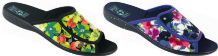
51 art. 23001 ZI/CZ