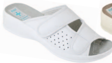
68 art. 22871 BI/BI.L