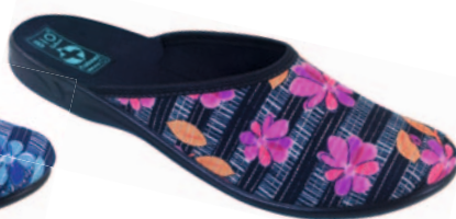
54 art. 23859 RC/CZ