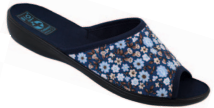
19 art. 18760 GR/CZ