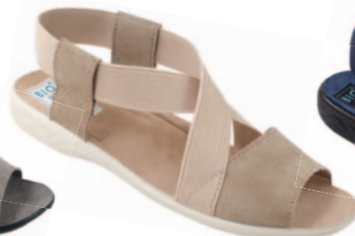
30 art. 17495 BZ/BZ