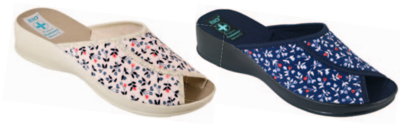
78 art. 23066 BZ/BZ