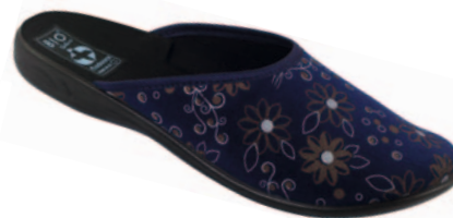
55 art. 22126 GR/CZ