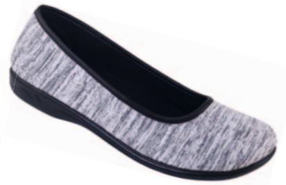
61 art. 23897 SZ/CZ