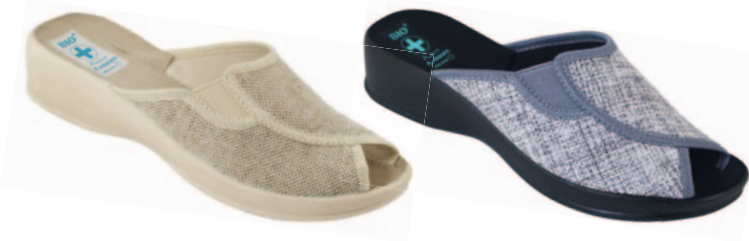
74 art. 16466 BZ/BZ