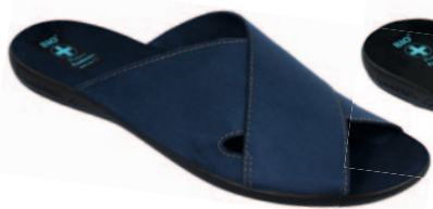
139 art. 20308 GR/CZ