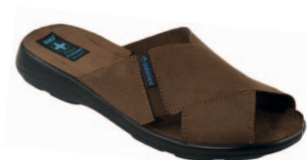
147 art. 16594 BR/CZ