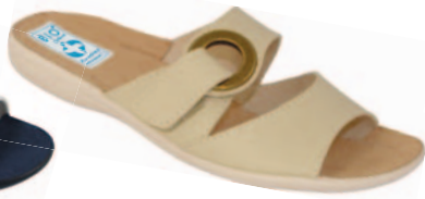
33 art. 11366 BZ/BZ