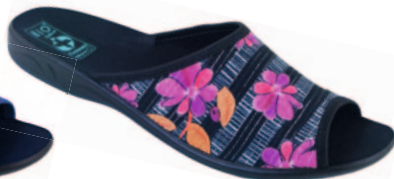
42 art. 23862 RC/CZ