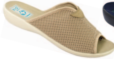
7 art. 20026 BZ/BZ