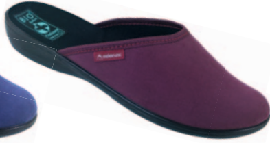
21 art. 23904 BU/CZ