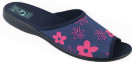
39 art. 22996 GRMA/CZ