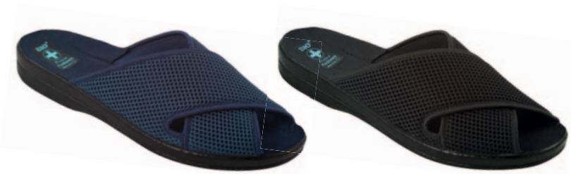
150 art. 16351 GR/CZ