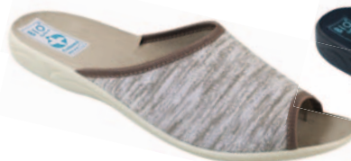
43 art. 23898 BZ/BZ