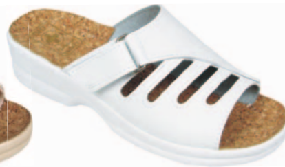
103 art. 4902 BI/BI.L