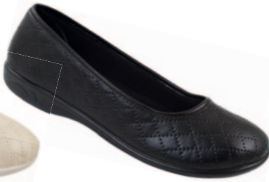
64 art. 18699 CZ/CZ