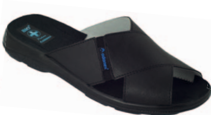
148 art. 13743 CZ/CZ