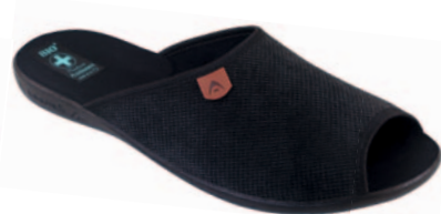
142 art. 23915 CZ/CZ