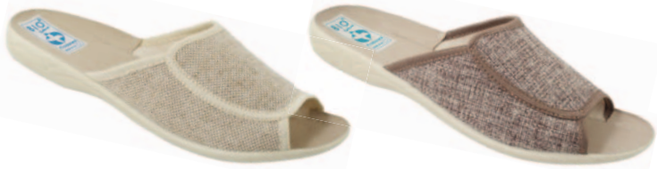
45 art. 16670 BZ/BZ