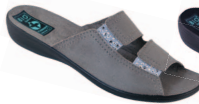
11 art. 23894 SZ/CZ