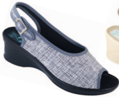
100 art. 22905 SZ/CZ