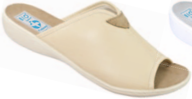
5 art. 20028 BZ/BZ