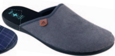
144 art. 23912 SZC/CZ