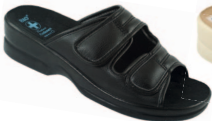
104 art. 16720 CZ/CZ