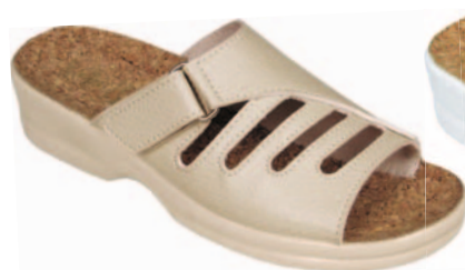
102 art. 4907 BZ/BZ