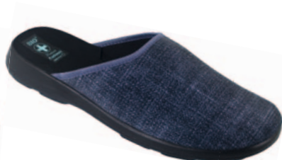
149 art. 22935 GR/CZ