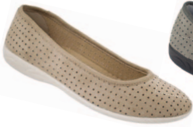
58 art. 16425 BZ/BZ