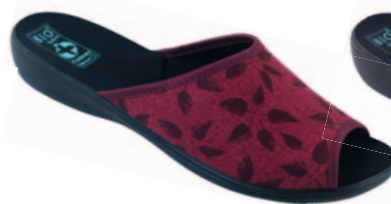
15 art. 23909 BO/CZ