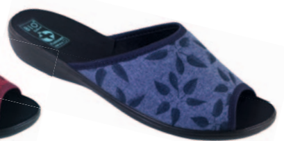
16 art. 23908 GR/CZ