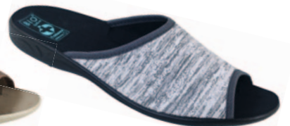
44 art. 23900 SZ/CZ