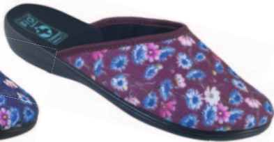
25 art. 23966 BU/CZ