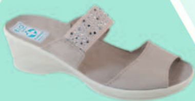
VENUS MODEL VEK17 - STRONA 10

Zapraszamy do zapoznania się z najnowszą, wiosenno – letnią kolekcją obuwia damskiego i męskiego, w której oprócz już sprawdzonych produktów, znajdziecie Państwo wiele ciekawych nowości.