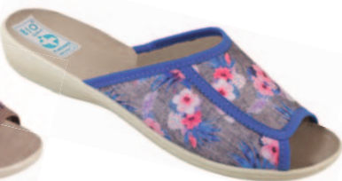
14 art. 23983 NI/BZ