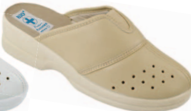
110 art. 16718 BZJ/BZ