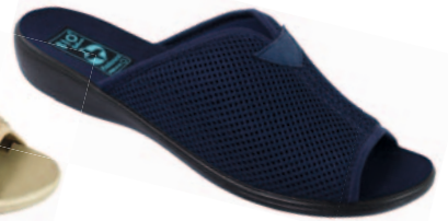
8 art. 20024 GR/CZ