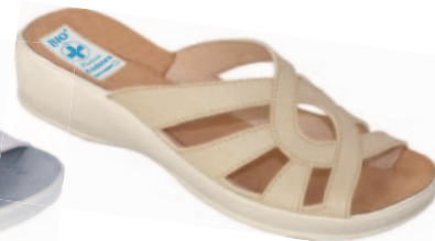
67 art. 11441 BZ/BZ