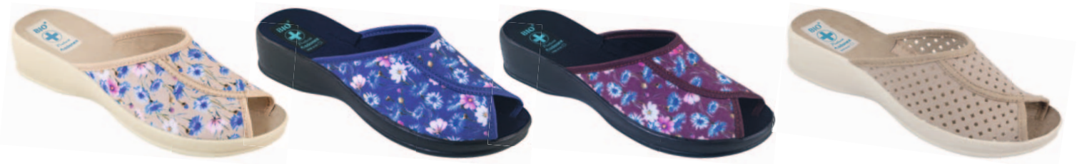
80 art. 23994 BZ/BZ