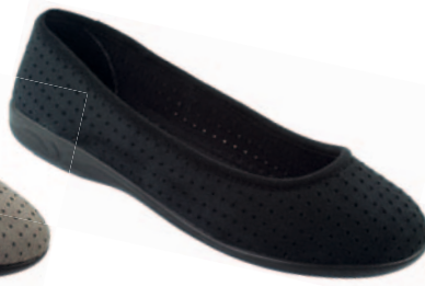
60 art. 16638 CZ/CZ