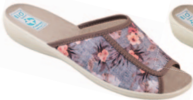
13 art. 23984 KA/BZ