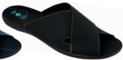
140 art. 20310 CZ/CZ