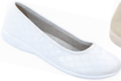
62 art. 18820 BI/BI.L