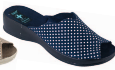
71 art. 22967 GR/CZ