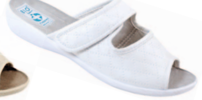
4 art. 18772 BI/BI.L