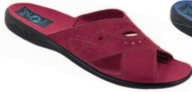
34 art. 18796 BO/CZ