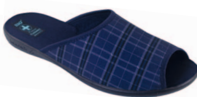
141 art. 23964 GR/CZ